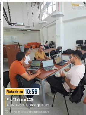
Reunión con Supervisor de Contrato para Materiales de Formación – 13/03/2026