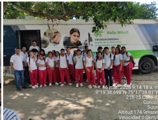
Aula Móvil IE Licapeve – 16/03/2026