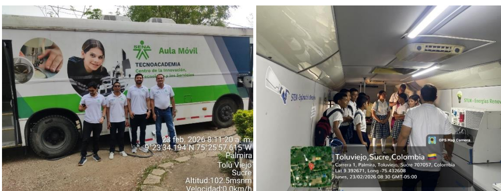
Aula móvil IE la Palmira - 23/02/2026