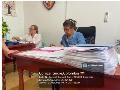
Reunión IE Licapeve – Programación de Curso Diseño y Modelado 3D – 27/02/2026