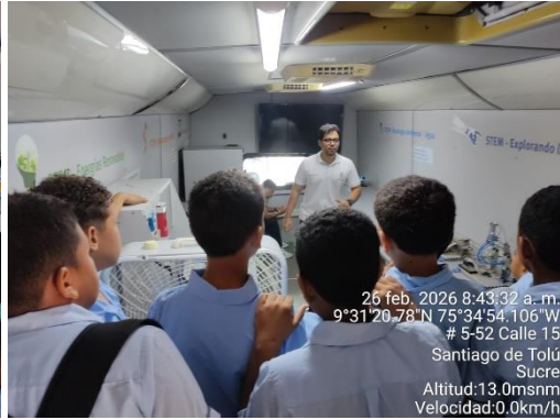
Aula Móvil - IE Técnica José Yemail Tous - 26/02/2026