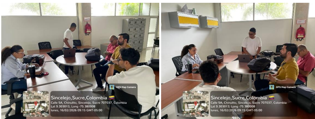
Capacitación Portafolio del instructor – Sena de Boston - 16/02/2026