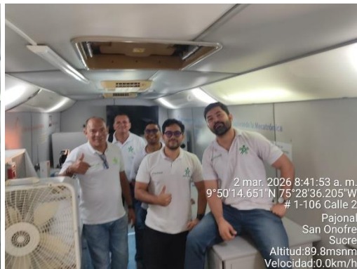
Aula Móvil - IE Educativa Afro Pajonal – 02/03/2026