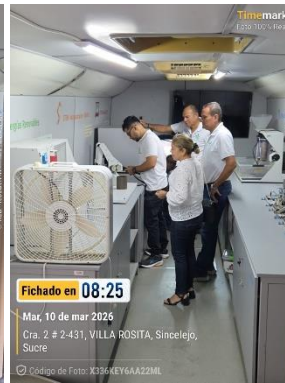
Aula Móvil IETA La Gallera – 10/03/2026