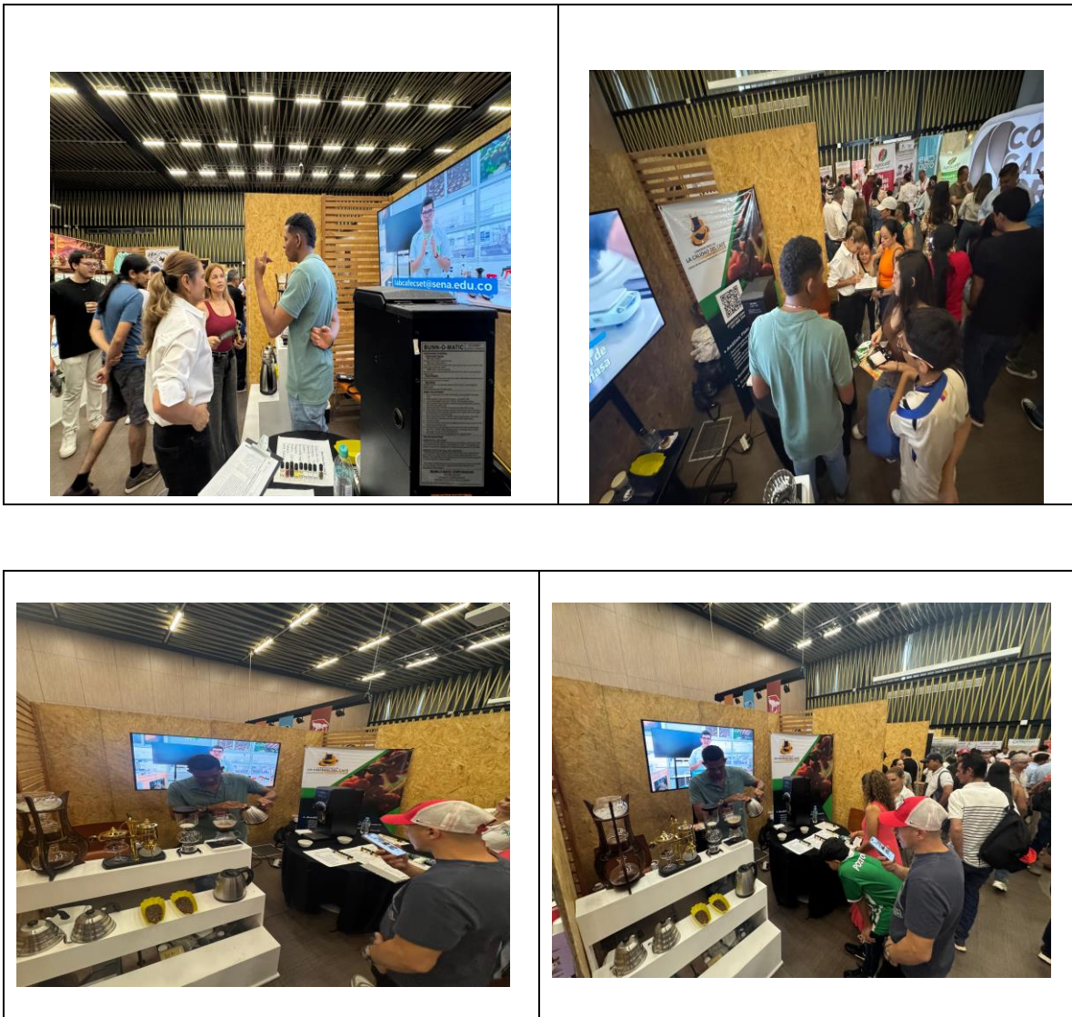
Evidencia No. 2

Participación en la IV Feria del Café, realizada en Neomundo, del 27 de febrero al 01 de marzo/2026, donde el Laboratorio de la Calidad del Café, contó con un stand, y se divulgó el portafolio de servicios tecnológicos, oferta de formación y demás actividades con el fin de promover el uso de los servicios del laboratorio y fortalecer las actividades de investigación, desarrollo e innovación (I+D+i) en el sector cafetero.