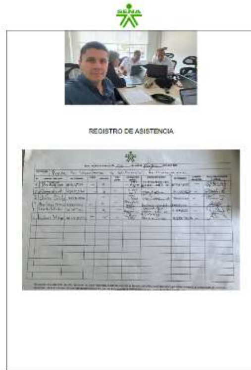
ANEXO 18: Registro fotográfico. Solicitud de fichas. 1er semestre 2026