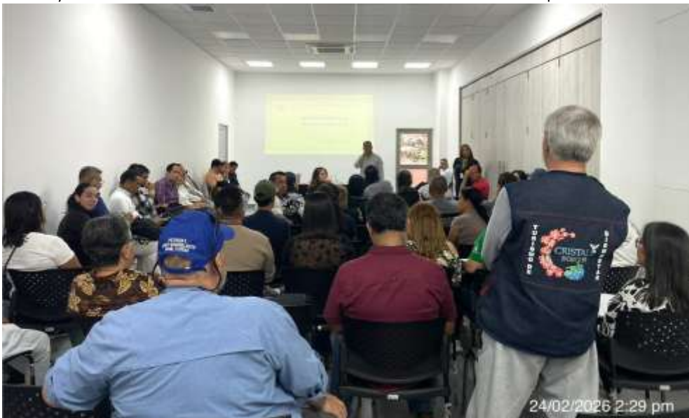
5.1.1 Registro fotográfico Reunión Núcleo Turismo-Yumbo

5.1 El contratista participa en el primer ejercicio de Núcleos Turismo realizado en las instalaciones de la Alcaldía de Yumbo con mas de 15 organizaciones convocadas desde el SENA y la secretaria de Desarrollo Económica de este municipio.