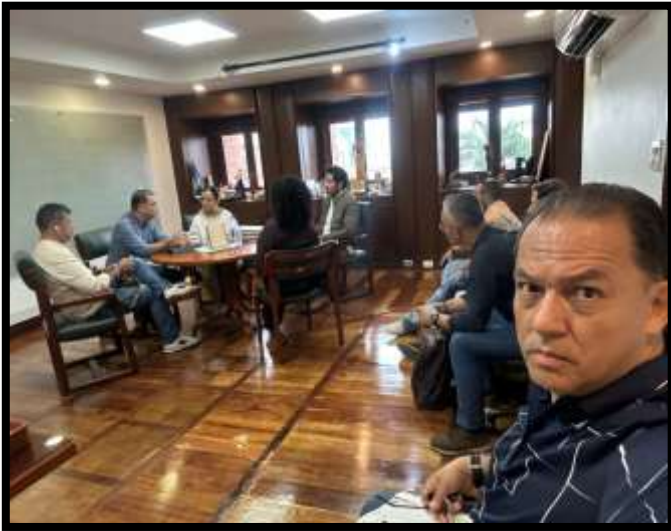
7.1.1. Registro fotográfico reunión SENA – secretaria Cultura de Cali.

7.1. El contratista asiste a reunión citada por director Regional con secretaria de Cultura de la ciudad de Cali en el marco del próximo Festival Petronio Álvarez, buscando participación de las Unidades productivas y Rurales SENA en el evento.