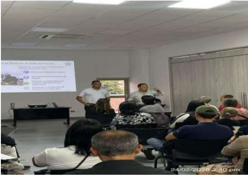
8.1.1 Registro fotográfico Reunión SENA – Emprendedores Yumbo

8.1. El contratista informa de manera oportuna las acciones adelantadas con los actores de la Economía Popular y Rural de Yumbo para articular acciones de atención en las convocatorias CampeSENA – Economía Popular, Multisectorial.