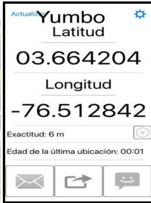
4.1.2 GPS Espacio físico del Núcleo.