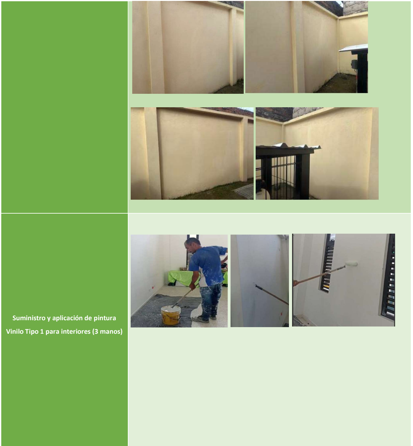
Suministro y aplicación de pintura Vinilo Tipo 1 para interiores (3 manos)