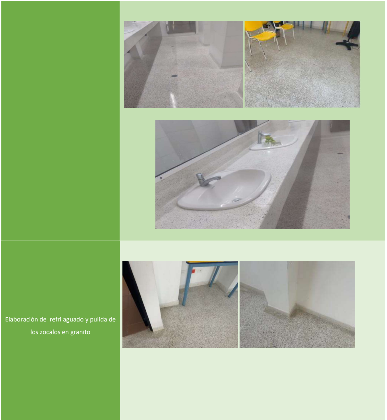
Elaboración de refri aguado y pulida de los zocalos en granito