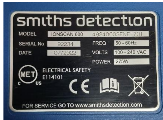
Fig. 1 Serial equipo

Ingresa unidad para revisión debido a falla reportada. Durante la verificación inicial se evidencia bloqueo permanente en los usuarios del sistema. Posteriormente, el equipo registra el error 35: "Falla bomba mecánica ANC".