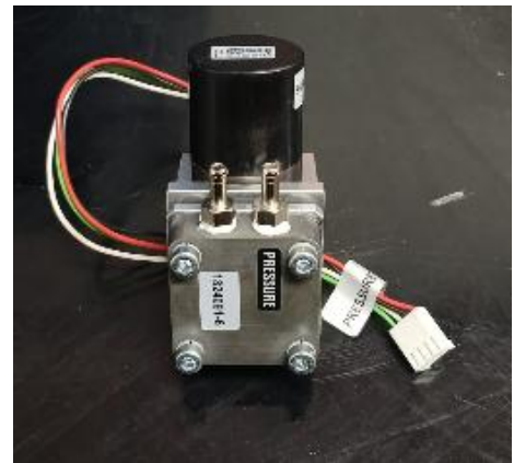
Fig. 2 y 3 Error 35 y Bomba presurización en falla.