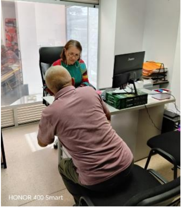
HONOR 400 Smart