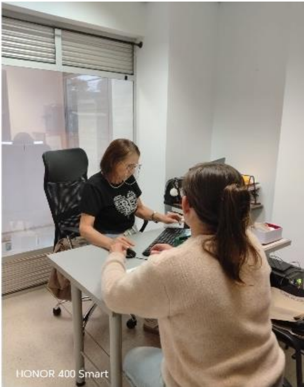
HONOR 400 Smart