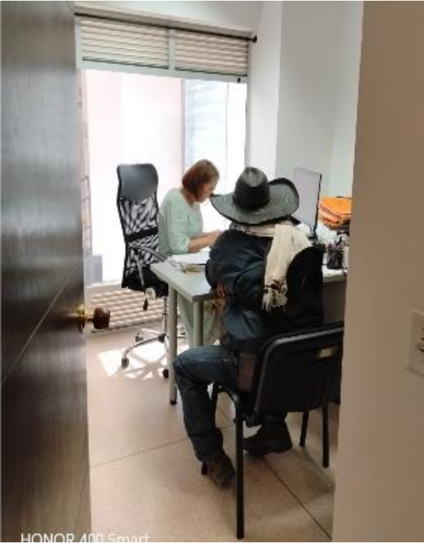
HONOR 400 Smart