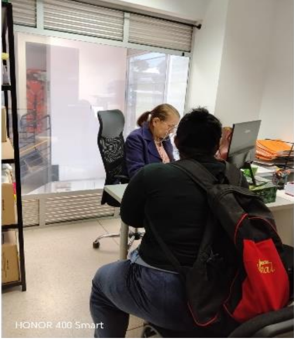
HONOR 400 Smart