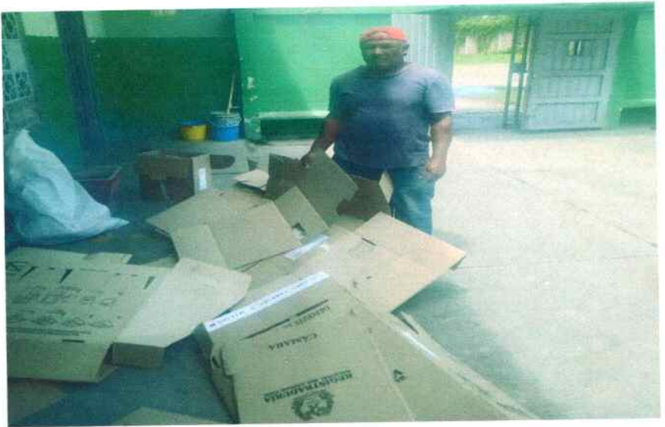
TRASLADO DE CUBICULOS A LOS PUNTOS DE VOTACION.