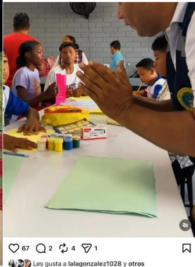
67 2 4 1 Les gusta a lalagonzalez1028 y otros epactg En el marco del Día Mundial del Agua, el EPA Cartagena lideró una jornada de educación ambiental con estudiantes de la Institución Educativa Jorge Artel. El objetivo fue sensibilizar a los jóvenes sobre la protección de los cuerpos de agua y el uso responsable del recurso hídrico. Esta iniciativa busca empoderar a los estudiantes como líderes ambientales en sus comunidades. Desde el EPA Cartagena, reafirmamos nuestro compromiso con la formación de ciudadanos conscientes de la preservación de la vida y el ecosistema.