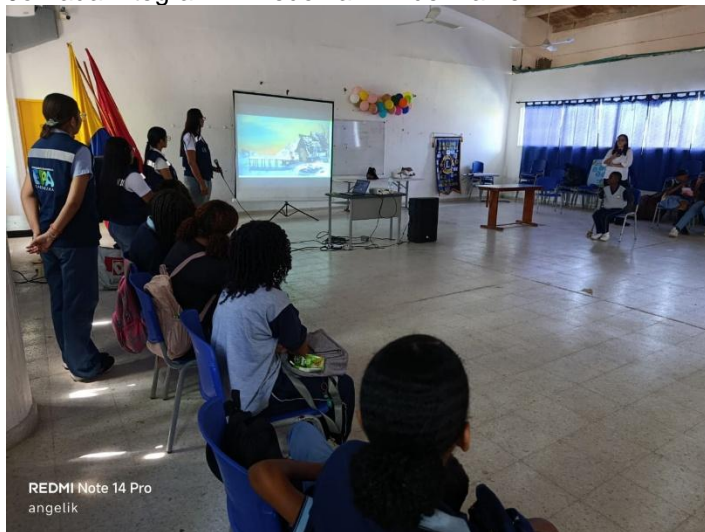
Jornada Integral IE Fredonia . 11 de Marzo

Se participó en la planeación, organización y ejecución de eventos académicos, jornadas pedagógicas y actividades comunitarias relacionadas con temas de investigación ambiental, innovación, educación ambiental y fortalecimiento de la cultura ambiental. Estas actividades incluyeron coordinación logística, convocatoria de participantes y apoyo en el desarrollo de las jornadas.