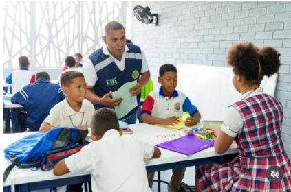
45 1 2 Les gusta a lalagonzalez1028 y otros epactg El futuro del agua está en manos de los más pequeños! En vísperas del Día Mundial del Agua (este domingo 22 de marzo), vivimos una jornada llena de magia y aprendizaje con los estudiantes de la I.E. Jorge Artel. A través de juegos y actividades lúdicas, sembramos una semilla fundamental: la conciencia ambiental. Creemos firmemente que instruir desde la infancia es la clave para que crezcan amando su entorno, protegiendo nuestra fauna y flora, y sintiéndose orgullosos de su territorio. Gracias al equipo de la Subdirección de Investigación y Educación Ambiental (SIEA) del EPA por diseñar esta experiencia tan especial. ¡Cuidar el agua es cuidar la vida!