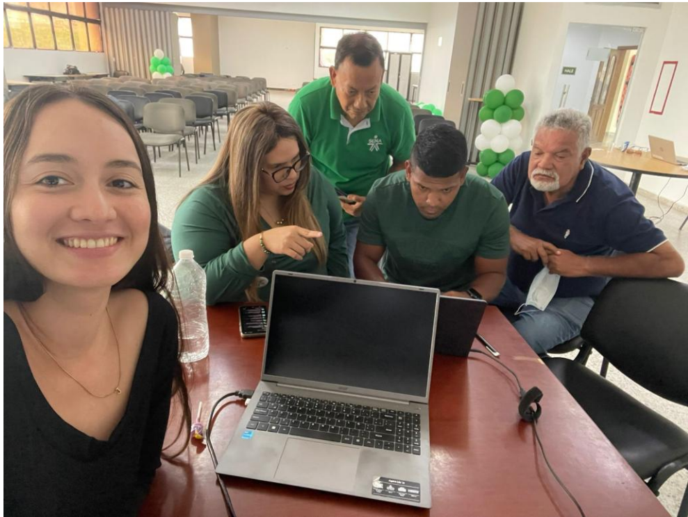
EVIDENCIA 3. PROYECTO DE BATERIA EN CONSTRUCCION EN EL APLICATIVO DSNFT.