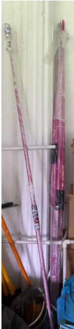
19. Bala de lanzamiento - 10