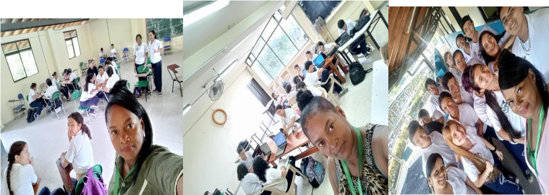
Evidencia de obligación 5. Fotografía donde se evidencia la participación en jornadas de pedagogía, para el mejoramiento de los procesos.