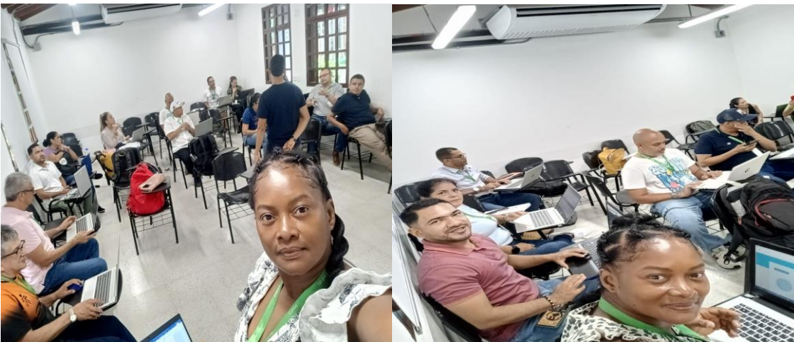
Evidencia de obligación 6. Lista de asistencia a la inducción.