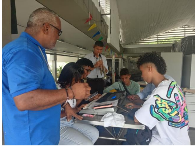
3. CANTE, AUNQUE NO CANTE, TOQUE,