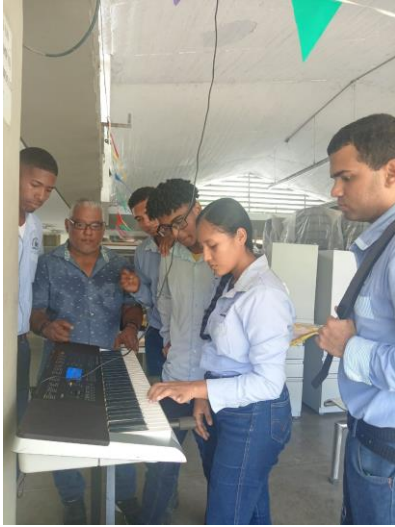
AUNQUE NO TOQUE