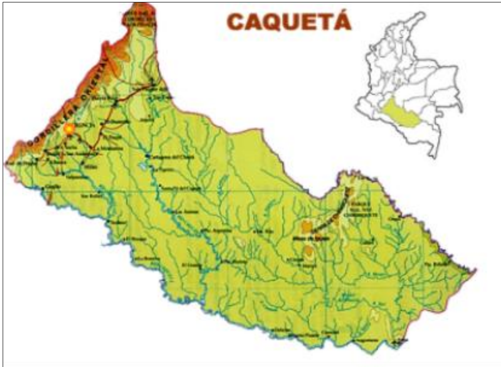
Figura 1.1. Ubicación geográfica del departamento del Caquetá