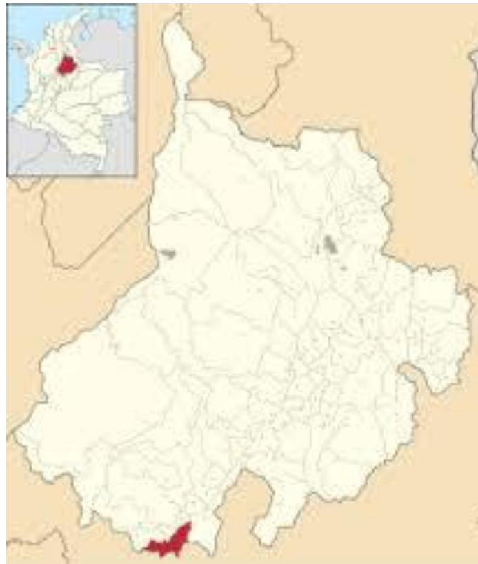
Ilustración 1. LOCALIZACION MUNICIPIO DE ALBANIA

El municipio de Albania se encuentra localizado geográficamente a 5° 46' 00" latitud norte y 73° 56' 00" longitud al oeste de Greenwich; entre las coordenadas planas: X= 1.141.000 m.N a la X = 1.124.000 m. N Y= 1.013.000 m.E a la Y = 1.038.000 m.E.