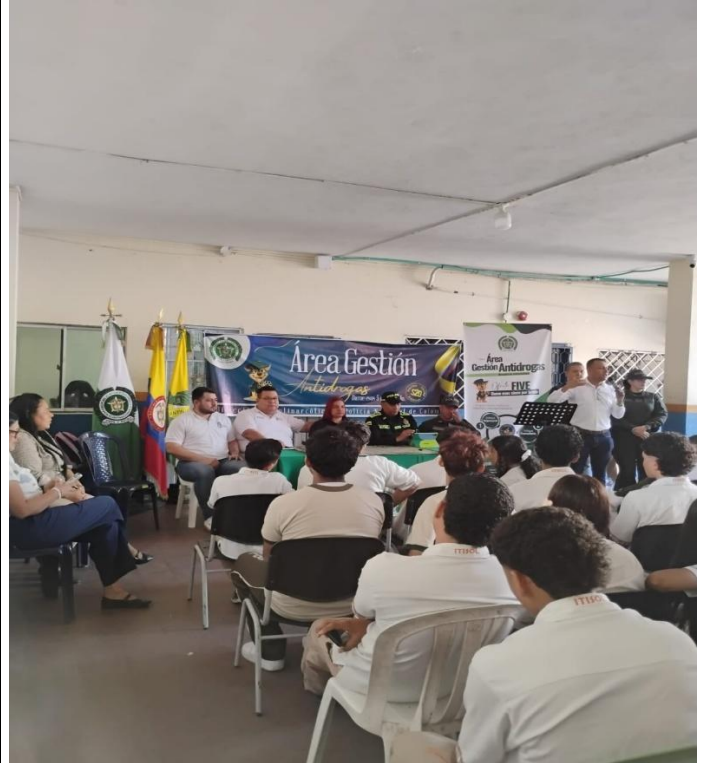
Asistencia a reuniones convocadas en la oficina de la secretaria de gobierno municipal.

4. Acompañar en las actividades y reuniones a las que sea convocada por la Secretaria de Gobierno Municipal.