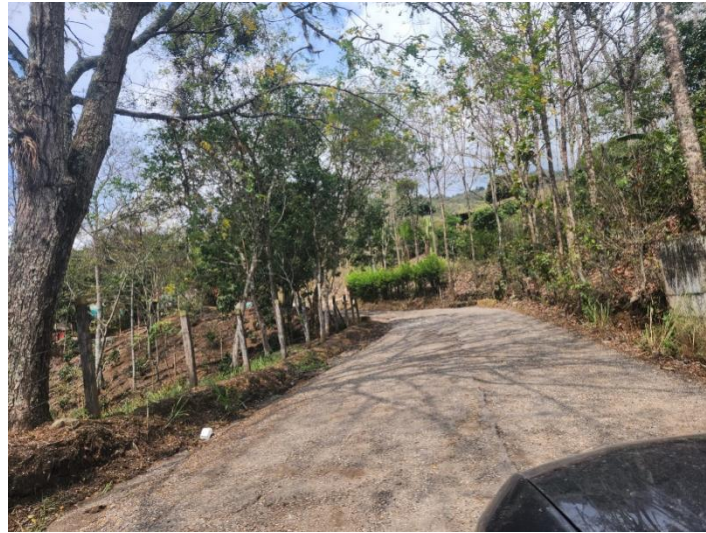
Fotografía 1. Envejecimiento de asfalto