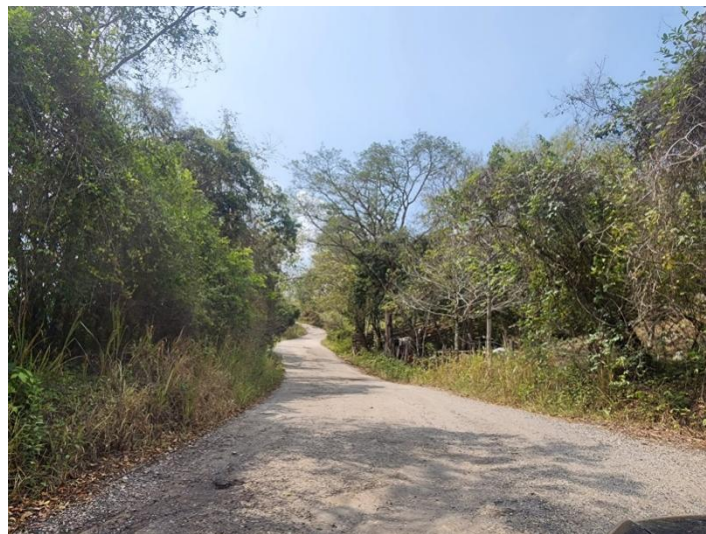
Fotografía 2. Sector en afirmado

En la Tabla 1 se muestran las coordenadas de localización de los sectores analizados.