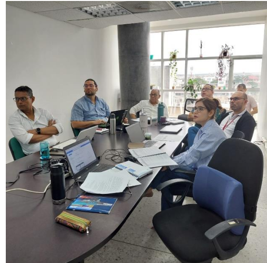
Imagen 3. Auditoría interna de calidad. Subsecretaría de Direccinamiento Estratégico (agosto 9).