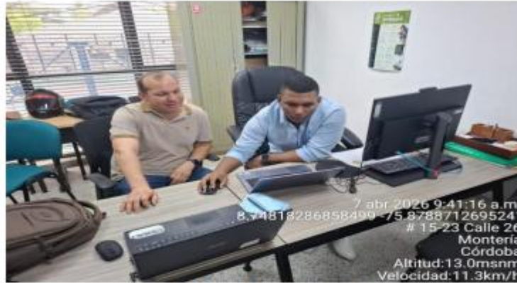
Imagen 1 Revisión de las baterías construidas.