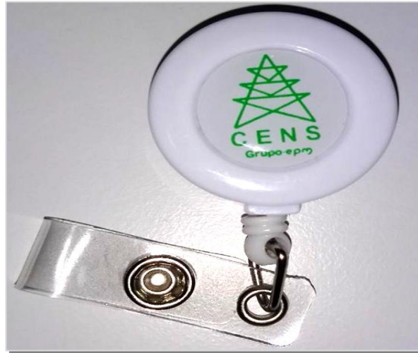
Ilustración 2. Imagen ilustrativa