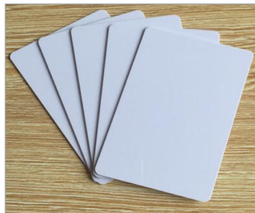
Ilustración 4. Imagen ilustrativa