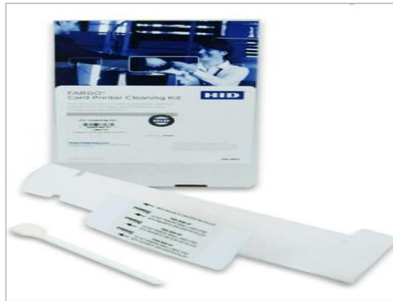
Ilustración 5. Imagen ilustrativa