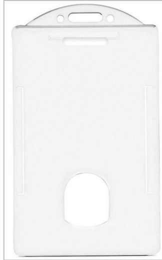
Ilustración 3. Imagen ilustrativa