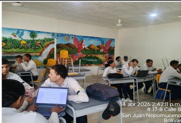
Aprendices de formación titulada, desarrollando actividades de socialización de temas asociados a estrategias de manejo de residuos sólidos en el municipio de San Juan Nepomuceno, Bolívar.