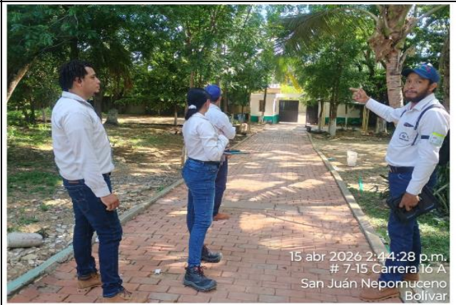
Aprendices de formación titulada, desarrollando actividades de socialización de temas asociados a estrategias de manejo de residuos sólidos en el municipio de San Juan Nepomuceno, Bolívar.