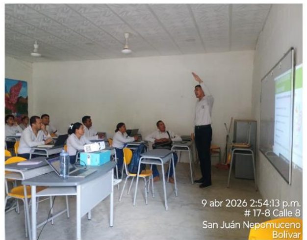
Aprendices de formación titulada, desarrollando actividades de socialización de temas asociados a estrategias de manejo de residuos sólidos en el municipio de San Juan Nepomuceno, Bolívar.