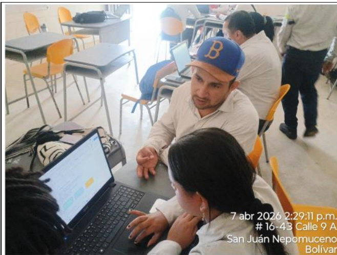
Aprendices de formación titulada, desarrollando actividades de flujo grama de residuos sólidos en el municipio de San Juan Nepomuceno, Bolívar.