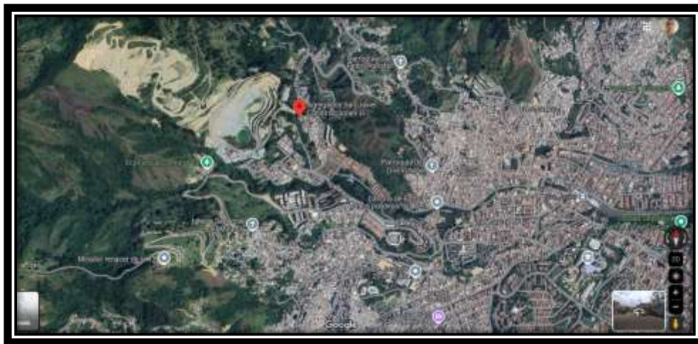
Ilustración 1. Plano General del proyecto

Estas actividades que son transversales a todos los componentes que intervienen en la ejecución están encaminadas a controlar, asegurar y evaluar el cumplimiento de los requisitos y necesidades manifestadas por la Empresa de Desarrollo Urbano (EDU), con el propósito de lograr la plena satisfacción de éste, con la ejecución del proyecto objeto del contrato de obra CO 344 DE 2024.