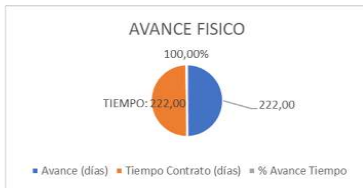
Ilustración 2. Avance en tiempo