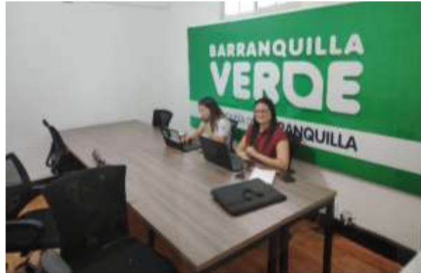
Ilustración 3. Capacitación Virtual, trámites ambientales EPA

El 20 de abril, se realizó acompañamiento a una reunión y visita técnica en el mercado Gran Bazar, con el objetivo de revisar los procesos ambientales existentes y definir acciones articuladas entre entidades y líderes comunitarios. Esta actividad permitió identificar oportunidades de mejora en la gestión de residuos sólidos, fortalecer estrategias de educación ambiental y avanzar en el ordenamiento de puntos críticos dentro de este espacio comercial.