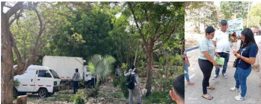
Ilustración 2. intervención Arroyo Cayenas

Posteriormente, el 13 de abril, esta contratista participó en una reunión de coordinación interinstitucional orientada a la intervención de la ladera del arroyo Las Cayenas. En este espacio se analizaron problemáticas asociadas a la acumulación de residuos sólidos, el crecimiento no controlado de cobertura vegetal y dinámicas sociales complejas en el sector. Se definieron compromisos institucionales, destacándose el rol de EPA Barranquilla Verde en la gestión de permisos de poda y tala, así como en el acompañamiento técnico y pedagógico a la comunidad. La actividad se realizó con éxito el día 17 de abril, desde educación ambiental hablamos sobre la importancia de cuidar la fauna silvestre urbana.