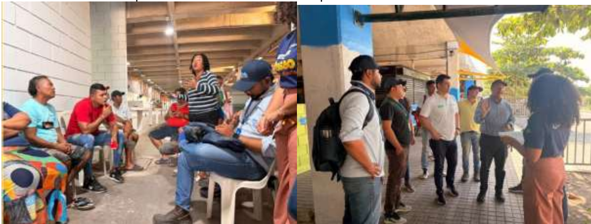
Ilustración 4. Reunión Gran Bazar

El 20 de abril, se realizó acompañamiento a una reunión y visita técnica en el mercado Gran Bazar, con el objetivo de revisar los procesos ambientales existentes y definir acciones articuladas entre entidades y líderes comunitarios. Esta actividad permitió identificar oportunidades de mejora en la gestión de residuos sólidos, fortalecer estrategias de educación ambiental y avanzar en el ordenamiento de puntos críticos dentro de este espacio comercial.