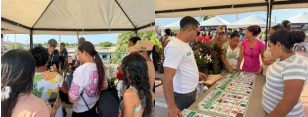
Ilustración 1. Feria pal Barrio Rebolo

educativas que solicitaron acompañamiento del Grupo de Educación Ambiental, facilitando la programación de visitas y jornadas pedagógicas orientadas a la sensibilización ambiental y apoyo al PRAE.