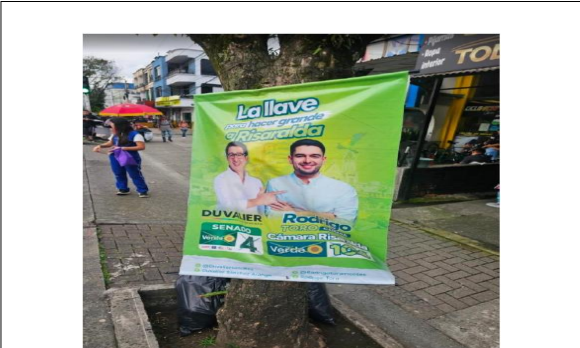
20/02/2026 Propaganda electoral en espacio público.