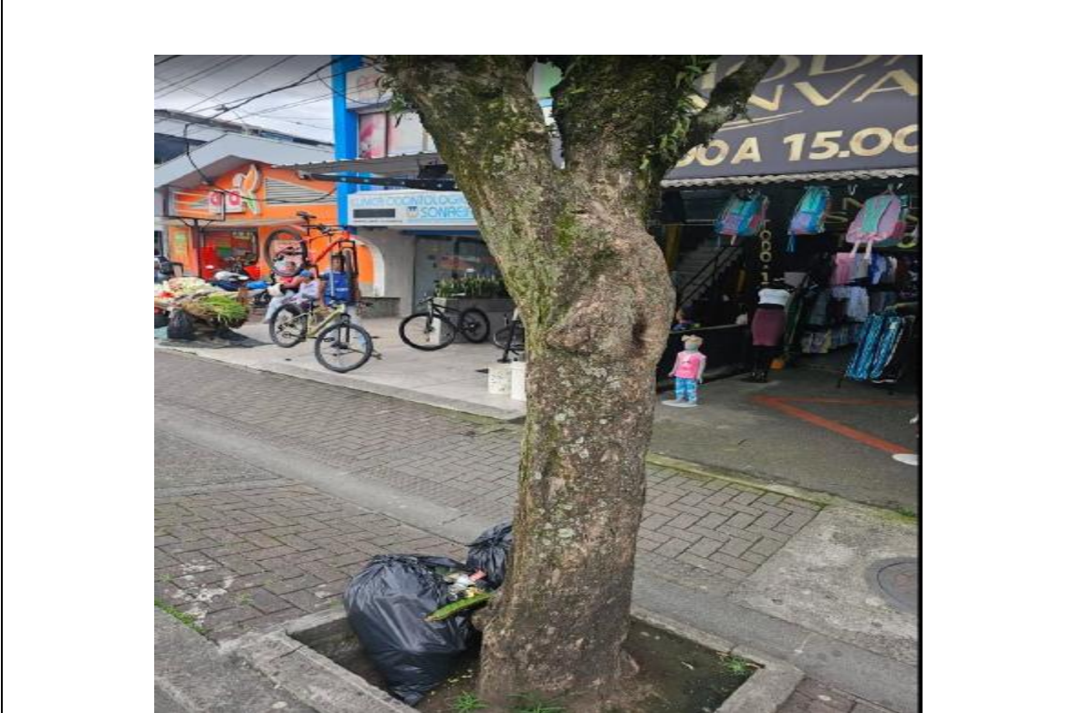
20/02/2026 Desmonte de propaganda electoral en espacio público