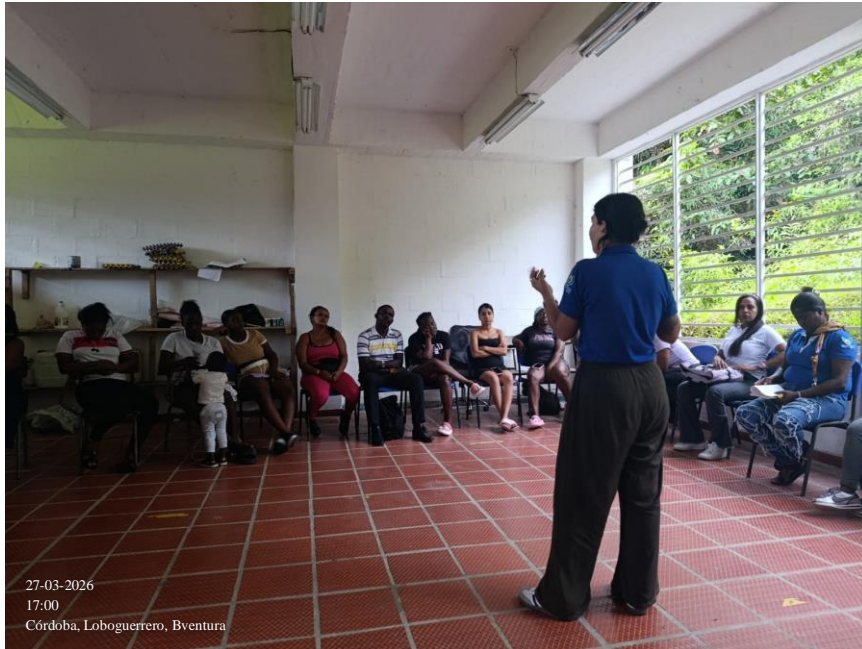
27-03-2026 17:00 Córdoba, Loboguerrero, Buenaventura