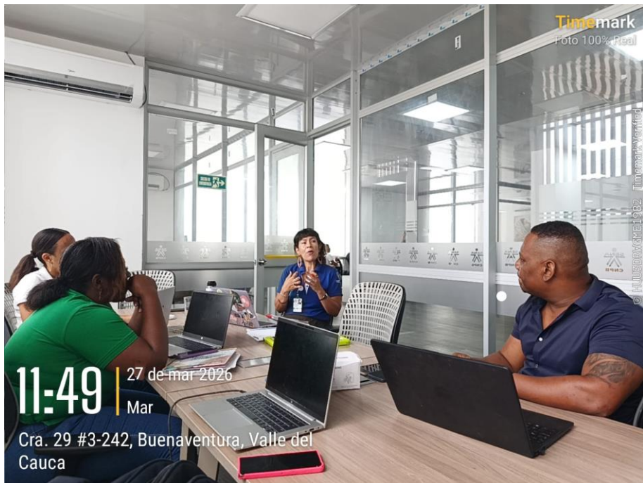
Registro fotográfico transferencia Metodología Economías Populares CNP B