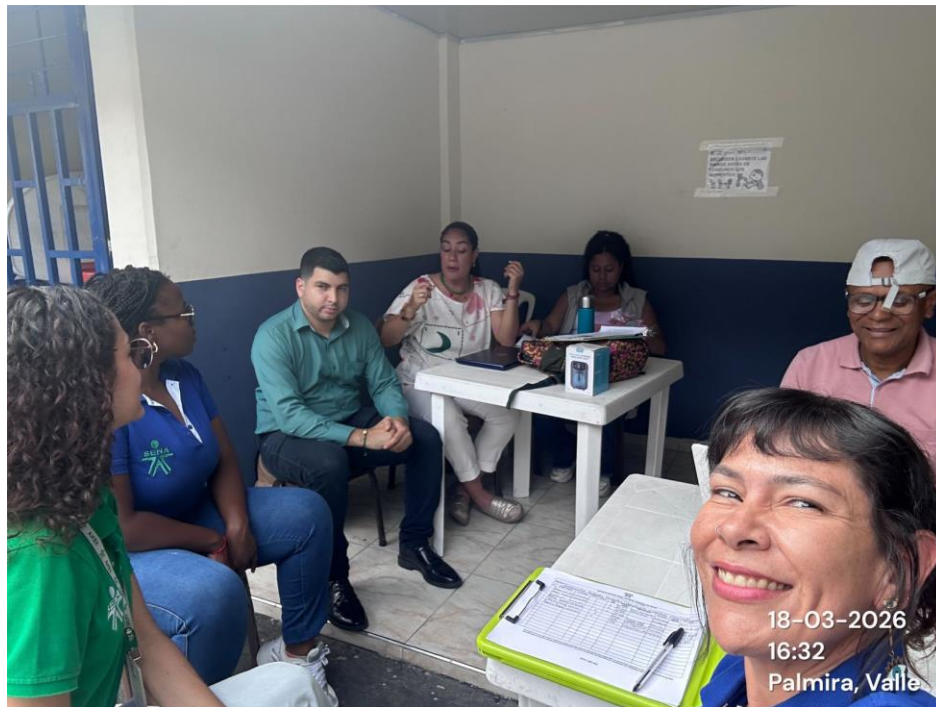
Articulación con Min. Igualdad, programa Jóvenes en Paz.