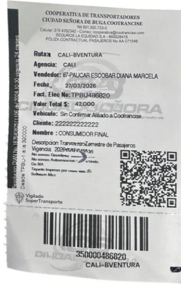
Tiquete de desplazamiento