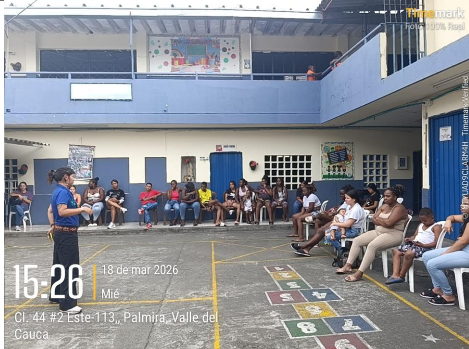
Socialización Programa Promotor Comunitario Población Orlidia- Palmira