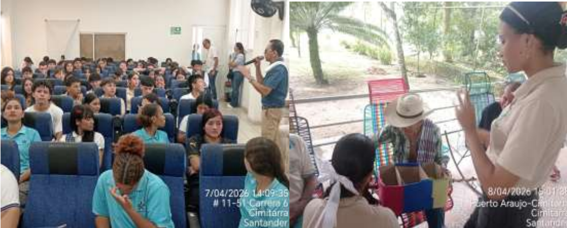
Registro del aula 101 de préstamo sede Sena Cimitarra mayo del 9 al de abril.