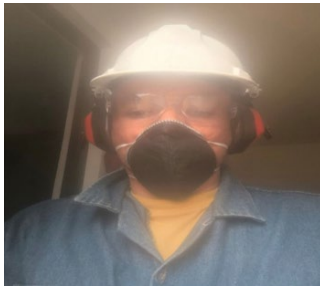
Pantallazos, Evidencia de la presentación de encuestas solicitados por el centro