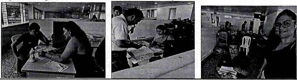
Registro fotográfico de la atención a los contribuyentes en la oficina de la cll 17 con cra 2ª.

Lo anterior, en cumplimiento a las obligaciones contractuales y para los fines pertinentes