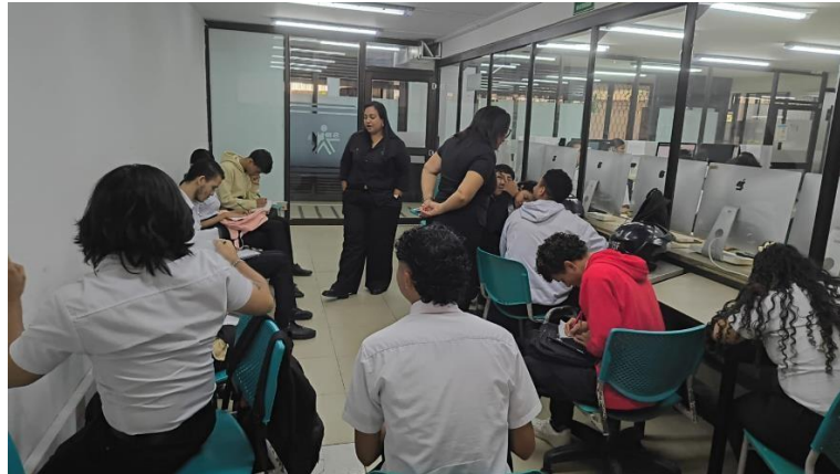
ACTIVIDAD REALIZADA: PROYECTO DE VIDA Y SEXUALIDAD - CENTRO INDUSTRIAL Y DE AVIACION, 6 DE ABRIL DEL 2026