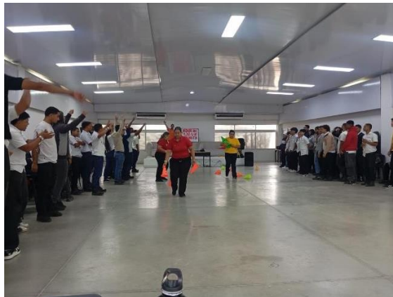
DIA MUNDIAL DE LA SALUD Y LA ACTIVIDAD FISICA - APRENDICES IMPACTADOS EN EL CENTRO INDUSTRIAL Y DE AVIACION EN JORNADA MIXTA, NOCTURNA Y 24 HORAS , NODO INDUSTRIAS CREATIVAS Y NODO DE CONSTRUCCION DEL 7 AL 13 DE ABRIL DEL 2023.