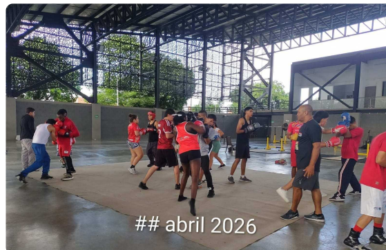
ESCUELA DE BOXEO DIRIGIDA