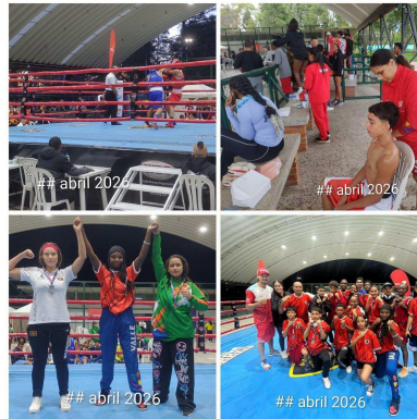
TORNEO NACIONAL DE CADETES EN BOGOTA 2026

Informe actividades Contrato # IND-26-1489 de 2,026.