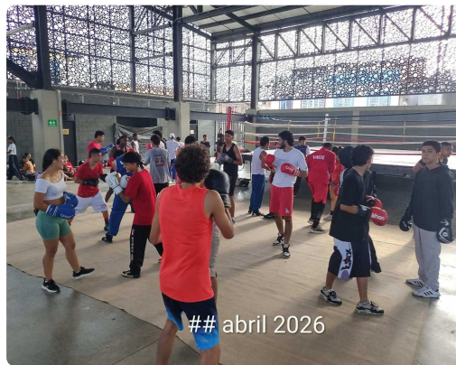
ESCUELA DE COMBATE LIBRE