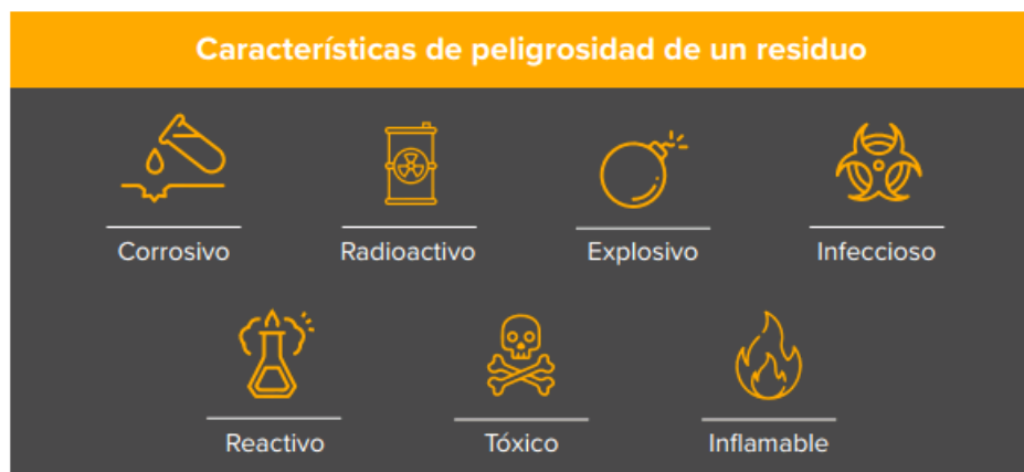
Ilustración 1: Características de los residuos peligrosos