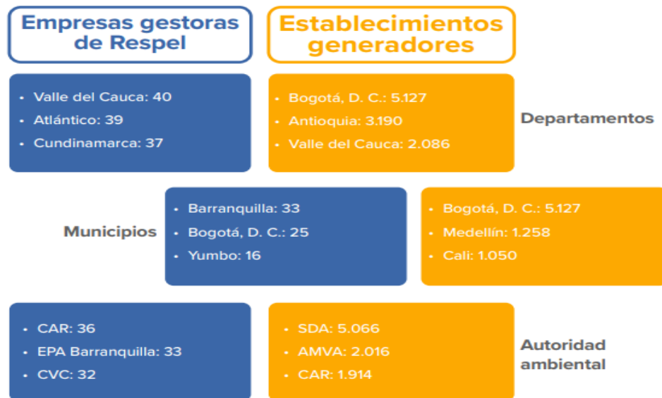
Ilustración 4: Ubicación de la cantidad de establecimientos generadores y empresas gestoras