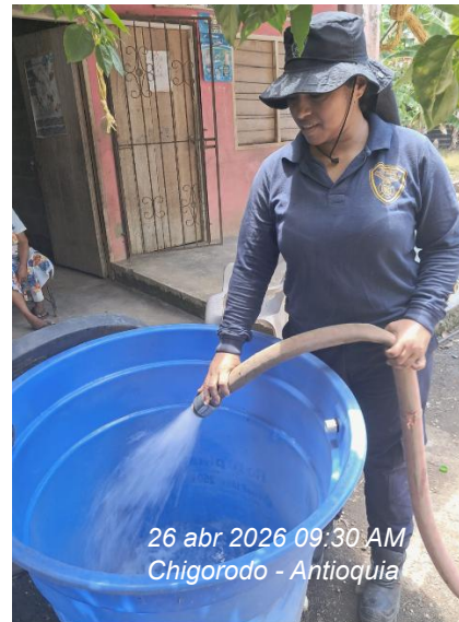
26 abr 2026 09:30 AM Chigorodó - Antioquia

Actividad: Abstenerse de promover, realizar política, ser neutral en la ejecución de las actividades.