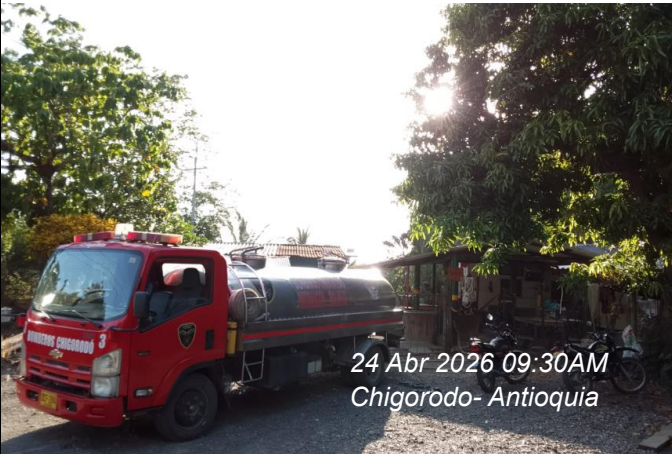
24 Abr 2026 09:30AM Chigorodó- Antioquia

Actividad: Cumplir con los vehículos utilizados para el abastecimiento de agua que estén identificados con la imagen institucional.