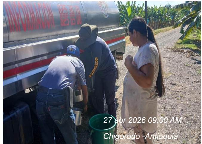
27 abr 2026 09:00 AM Chigorodo -Antioquia