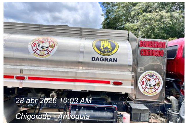
28 abr 2026 10:03 AM Chigorodo - Antioquia