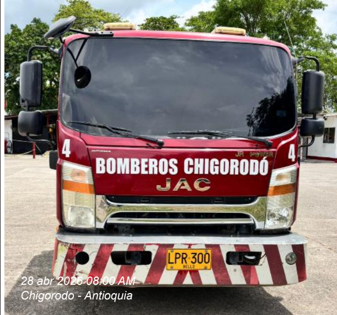
28 abr 2026 08:00 AM Chigorodó - Antioquia