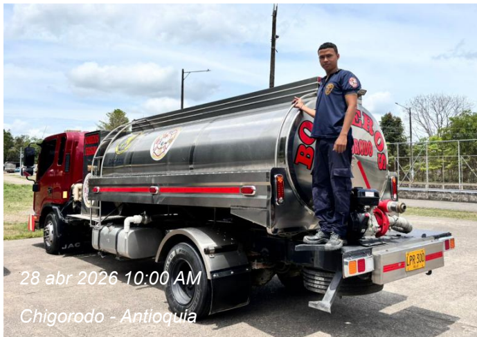
28 abr 2026 10:00 AM Chigorodo - Antioquia

Actividad: Garantizar elementos de protección para el personal que va desarrollar las actividades.