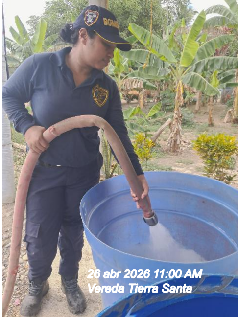
26 abr 2026 11:00 AM Vereda Tierra Santa