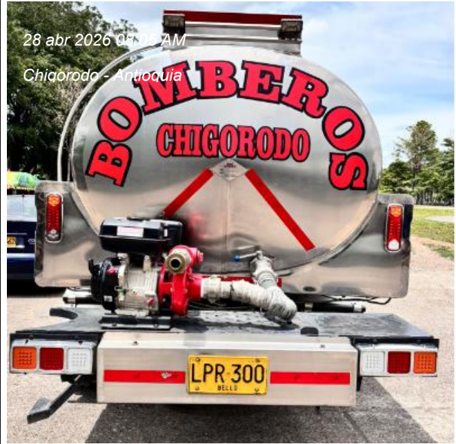
28 abr 2026 08:00 AM Chigorodó - Antioquia