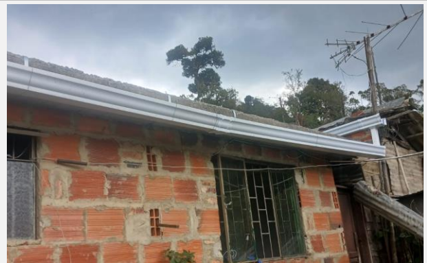
Ilustración 4. CANALES INSTALADAS