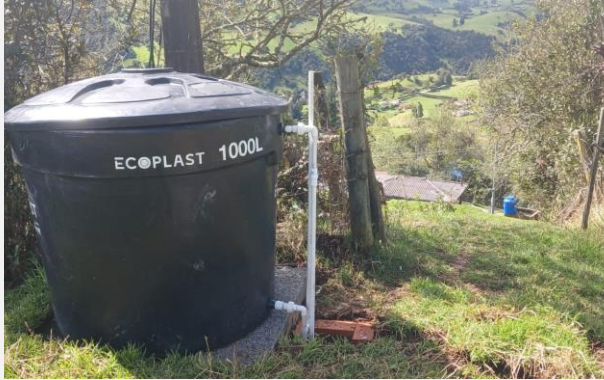
Ilustración 7. TANQUE INSTALADO