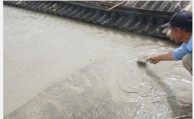
Ilustración 2. IMPERMEABILIZACION DE PLACA