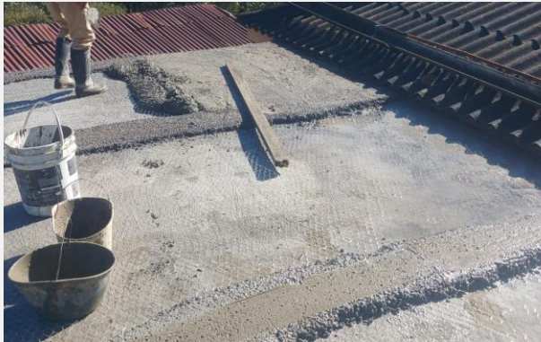
Ilustración 1. MORTERO IMPERMEABILIZADO