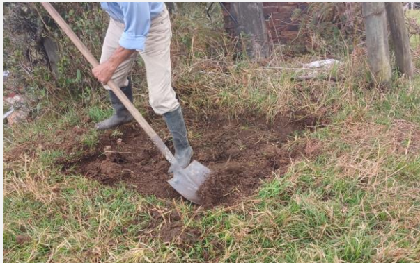
Ilustración 5. EXCAVACION MANUAL