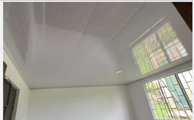
Ilustración 10. TECHO PVC INSTALADO