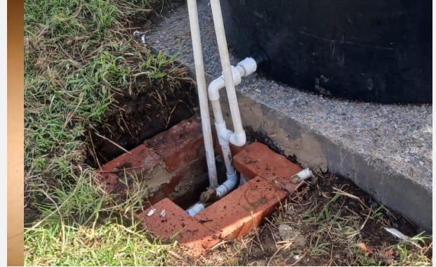
Ilustración 8. CAJA Y ACCESORIOS INSTALADOS