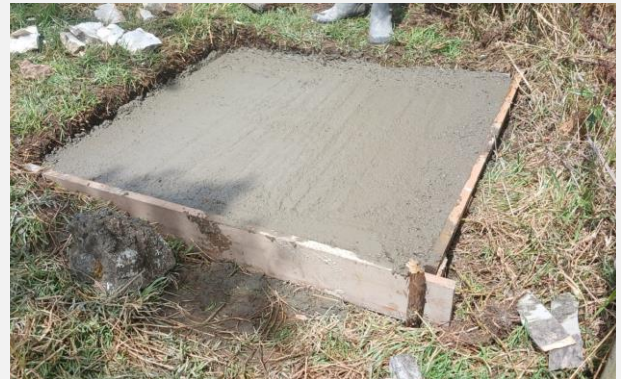
Ilustración 6. PLACA PARA TANQUE