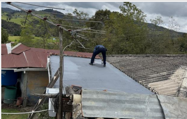
Ilustración 3. IMPERMEABILIZACION DE PLACA