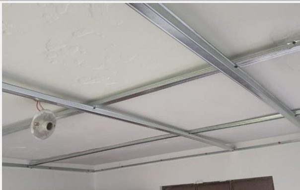
Ilustración 9. ESTRUCTURA TECHO PVC