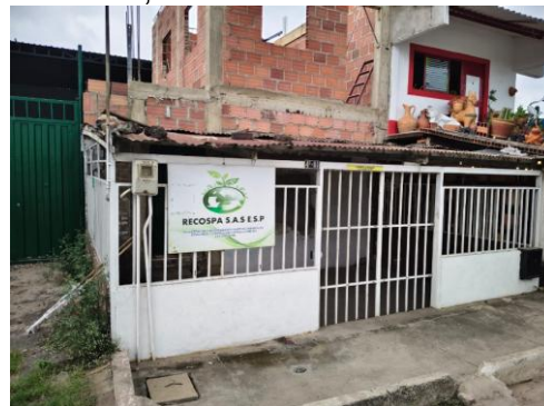
Fotografía 2. Sede Recospa.