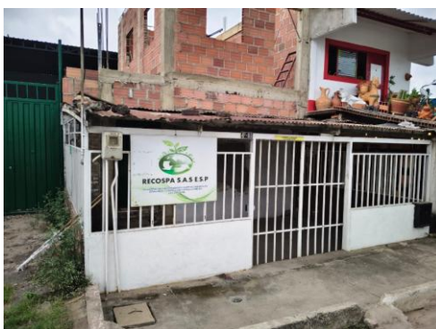
Fotografía 2. Sede Recospa.