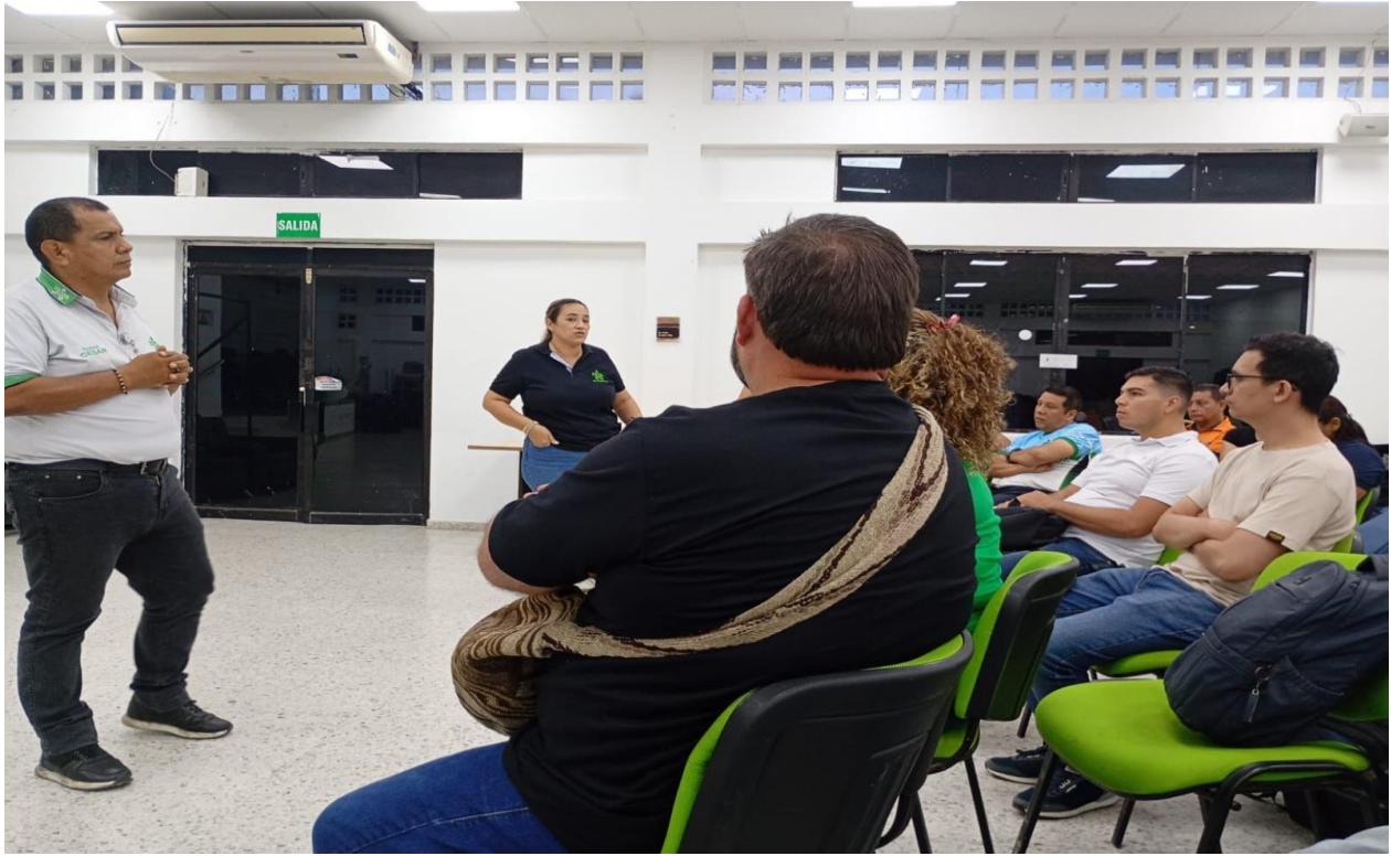
Obligación 12: Verificación de formación.