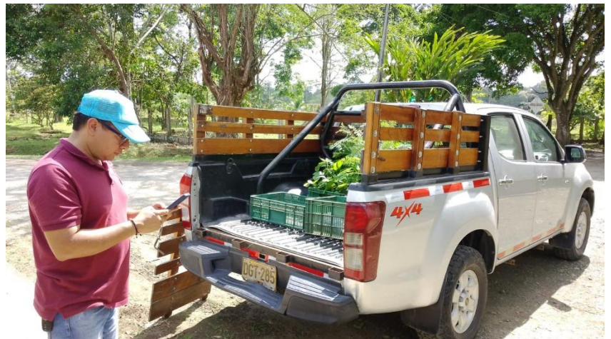
10. Acompañamiento técnico a las actividades del vivero municipal