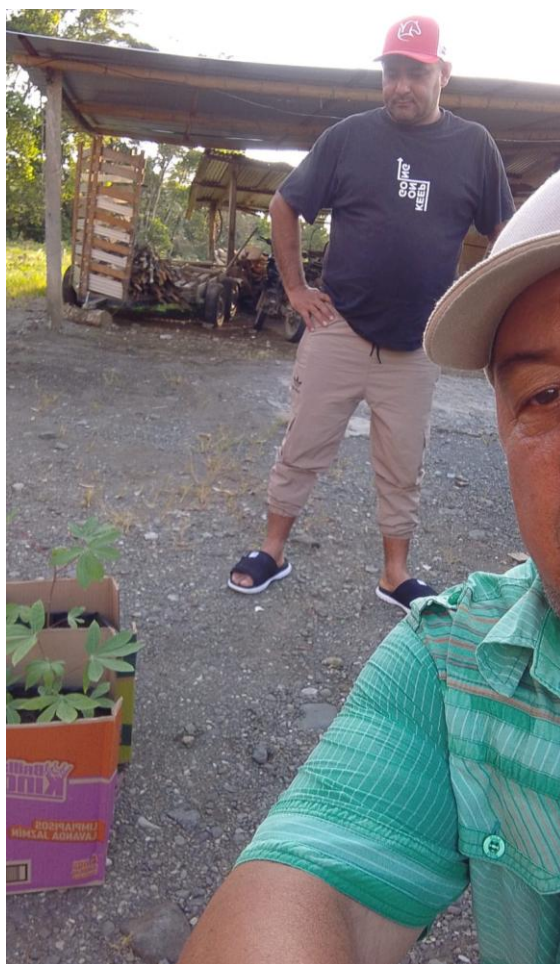
Seguimiento a ejecución de proyectos productivos.

9. Seguimiento a proyectos productivos y de innovación para el sector productivo.