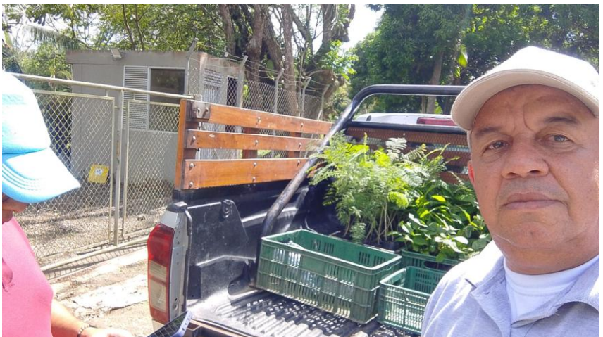
11. Esta y las demás funciones de común acuerdo con el supervisor del contrato

Para el presente periodo no se registra el cumplimiento de dicha obligacion contractual.