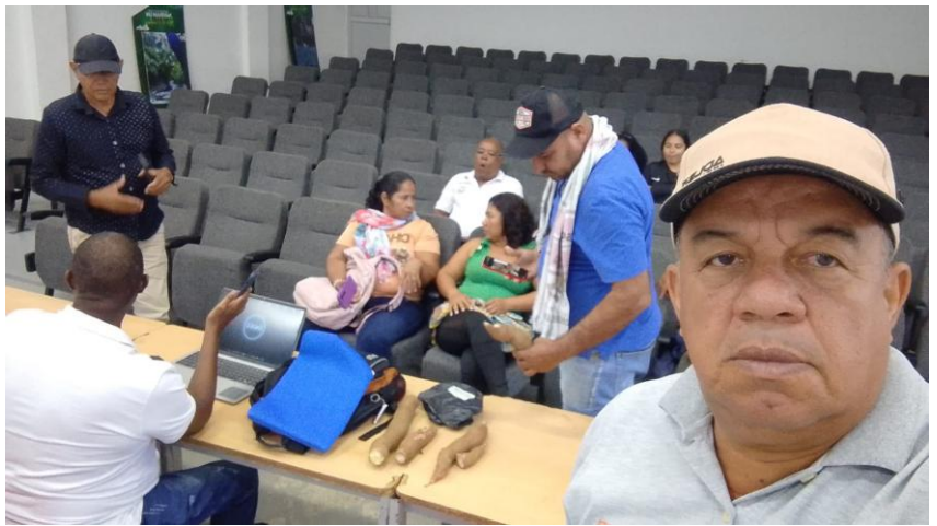
Recepcion de material vegetal.