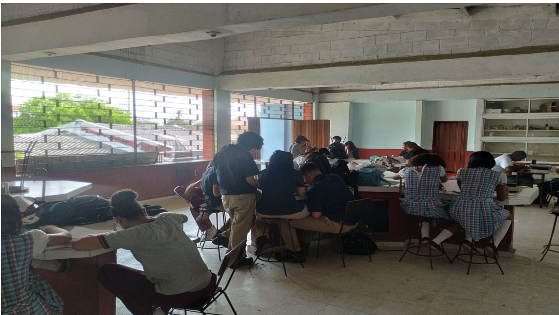
Formación presencial FICHA 3467267 IE NOROCCIDENTAL 20 al 25 de abril del 2026