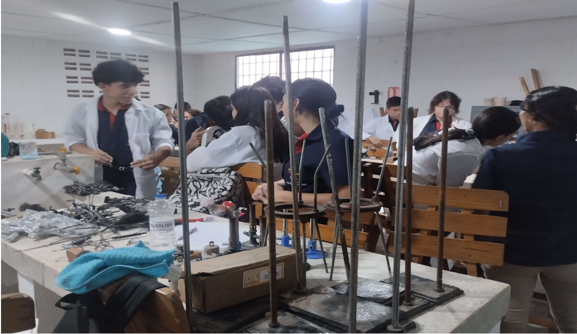
Formación presencial FICHA 3471573 IE EXPERIENCIAS PEDAGOGICAS del 27 al 30 de abril del 2026