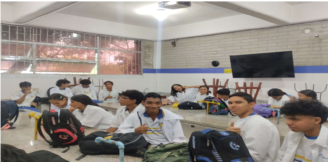
Formación presencial FICHA 3460786 IE MARIA CANO del 20 al 25 de abril del 2026