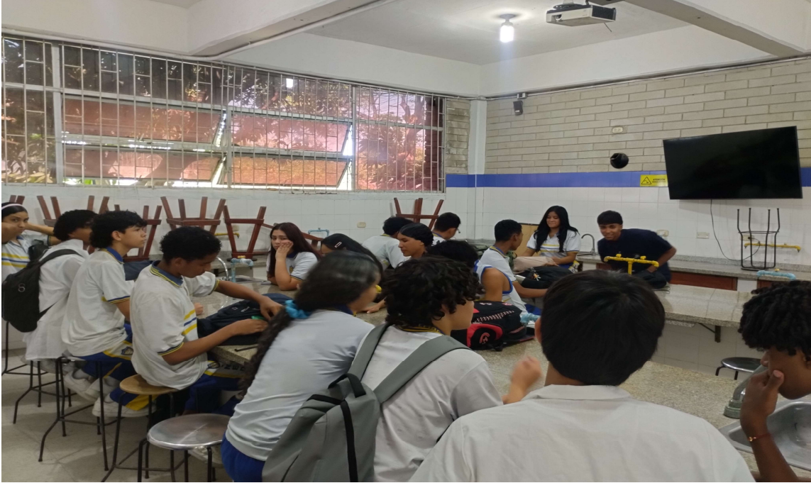
Formación presencial FICHA 3460786 IE MARIA CANO del 27 al 30 de abril del 2026