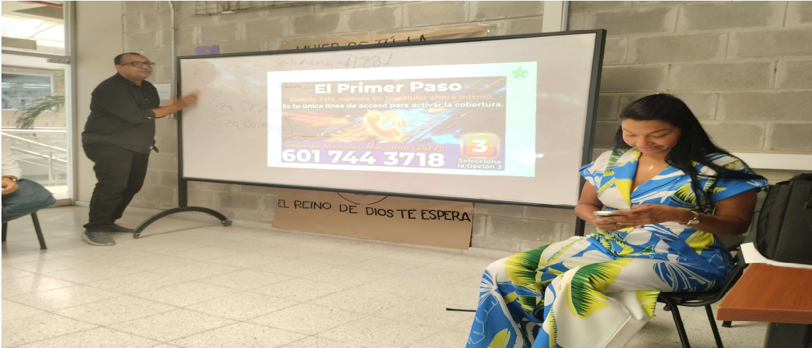
Reunión presencial articulación con la media CNCA 20 de abril del 2026