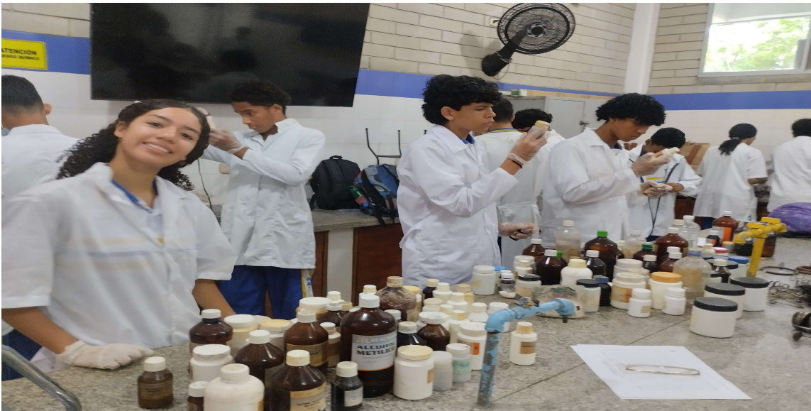
Formación presencial FICHA 3460786 IE MARIA CANO del 4 al 9 de mayo del 2026