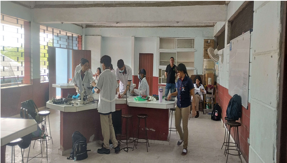
Formación presencial FICHA 3467267 IE NOROCCIDENTAL del 4 al 9 de mayo del 2026