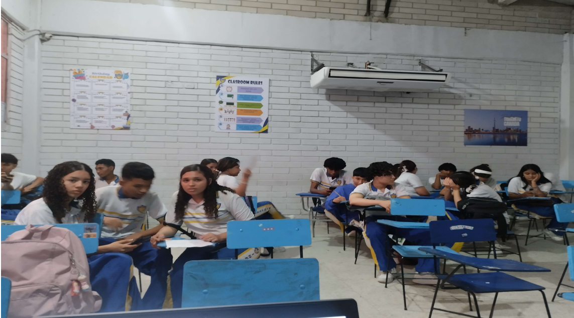
Formación presencial FICHA 3460786 IE MARIA CANO del 13 al 18 de abril del 2026