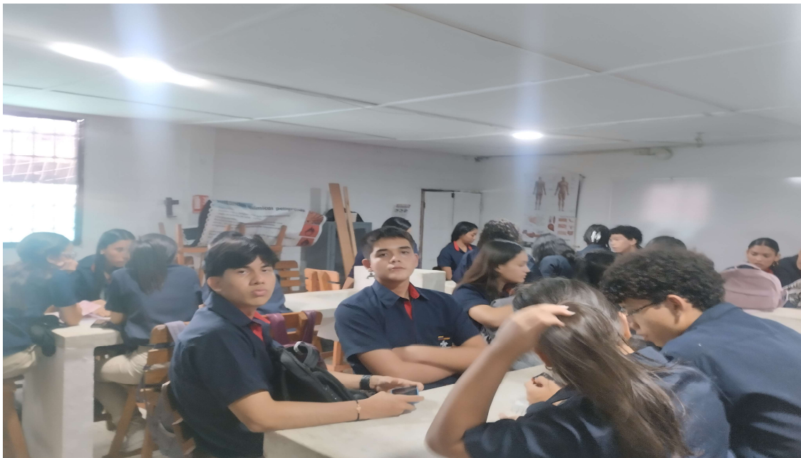
Formación presencial FICHA 3471573 IE EXPERIENCIAS PEDAGOGICAS del 20 al 25 de abril del 2026