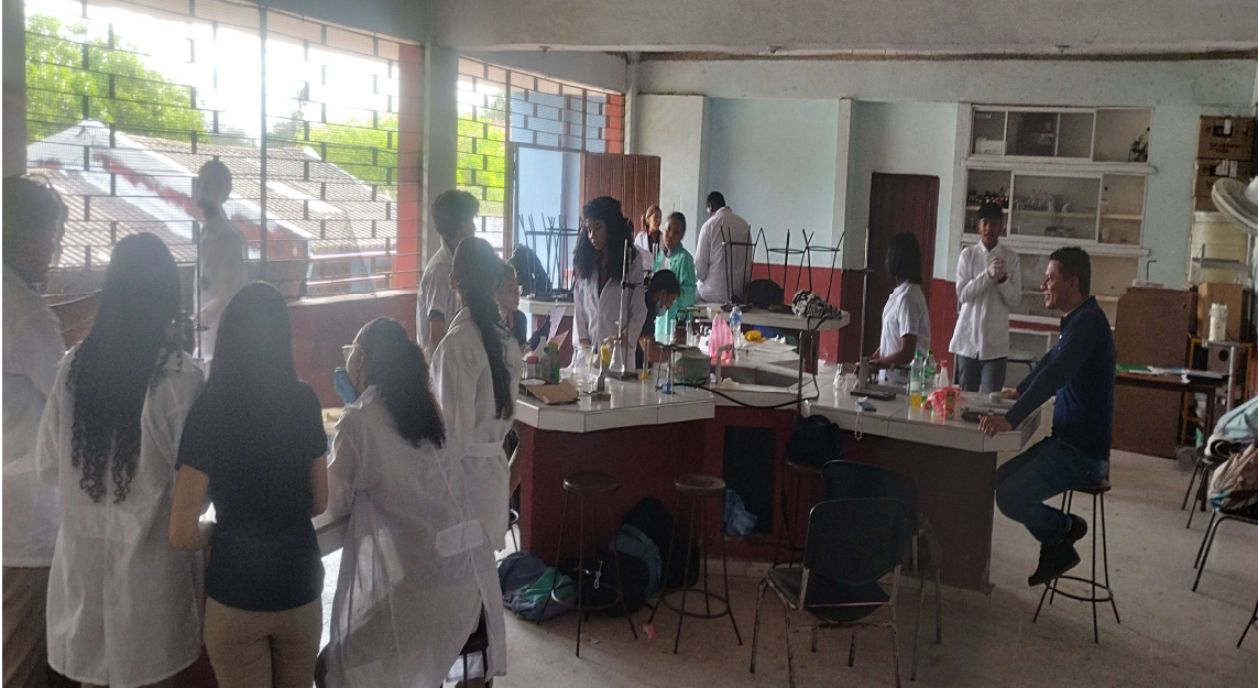
Formación presencial FICHA 3467267 IE NOROCCIDENTAL del 13 al 18 de abril del 2026