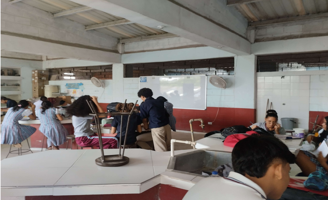
Formación presencial FICHA 3467267 IE NOROCCIDENTAL del 27 al 30 de abril del 2026