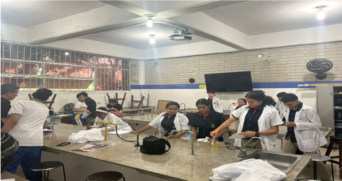
Formación presencial FICHA 3187221 IE MARIA CANO del 4 al 9 de mayo del 2026