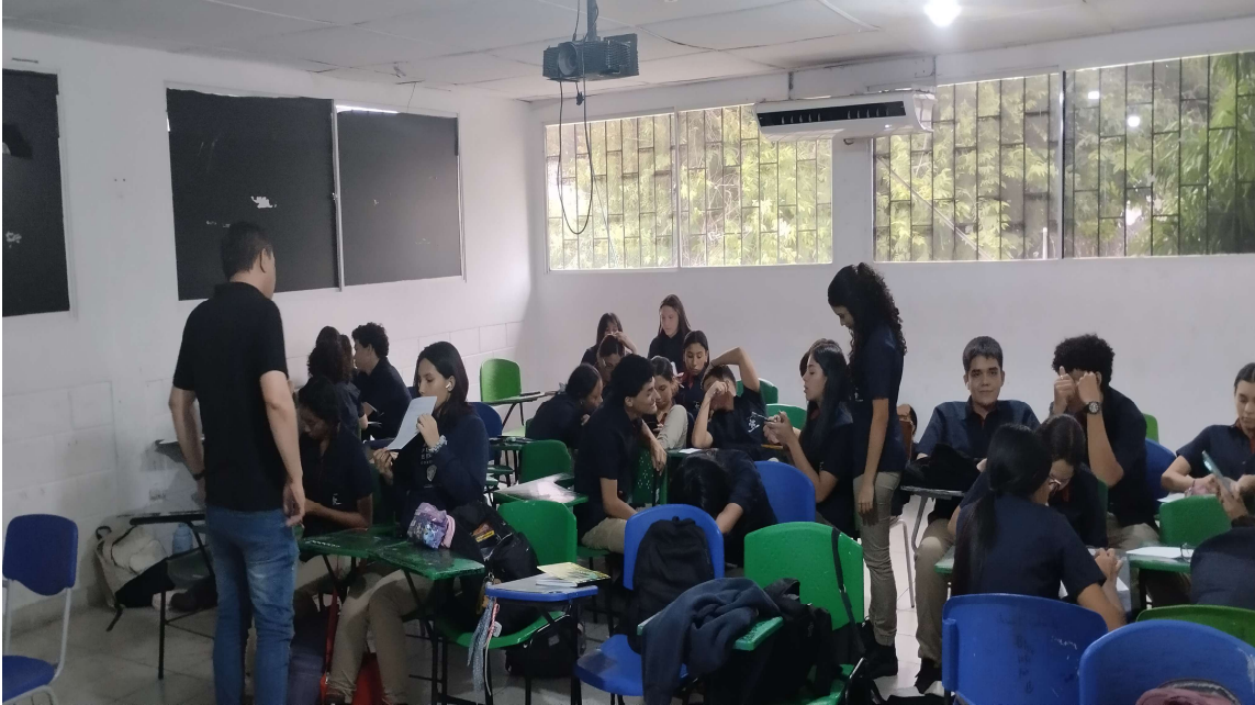
Formación presencial FICHA 3471573 IE EXPERIENCIAS PEDAGOGICAS del 13 al 18 de abril del 2026