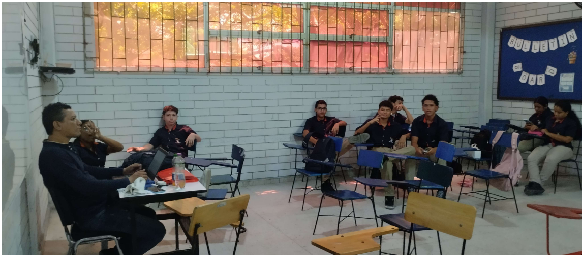
Formación presencial FICHA 3187221 IE MARIA CANO del 13 al 18 de abril del 2026