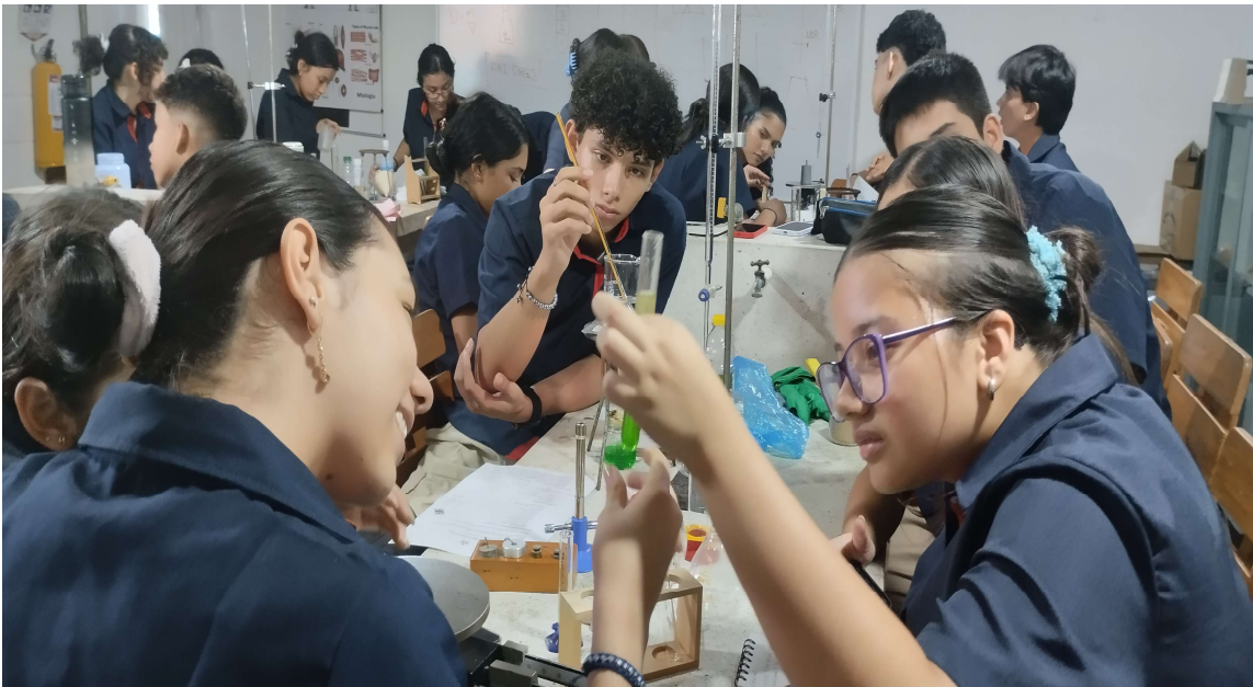
Formación presencial FICHA 3471573 IE EXPERIENCIAS PEDAGOGICAS del 4 al 9 de mayo del 2026