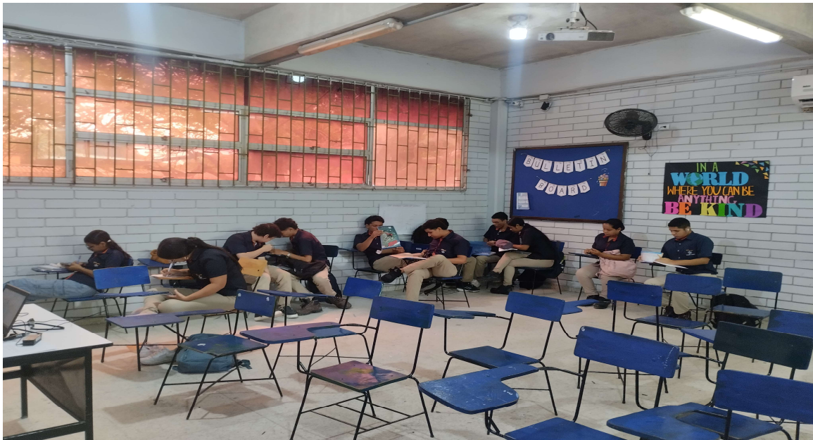
Formación presencial FICHA 3187221 IE MARIA CANO del 20 al 25 de abril del 2026