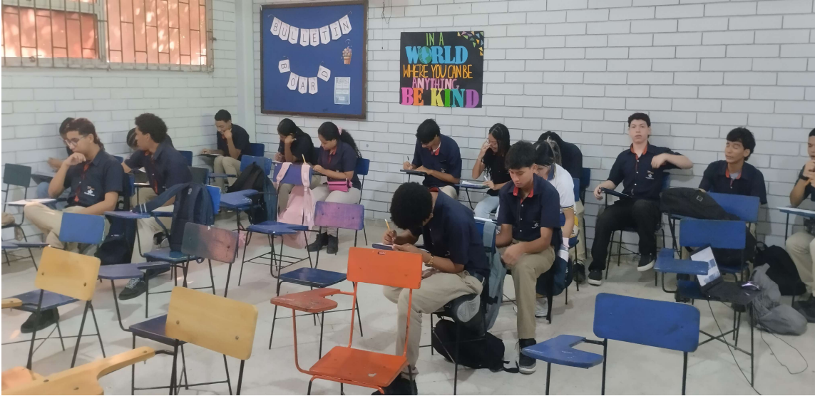
Formación presencial FICHA 3187221 IE MARIA CANO del 27 al 30 de abril del 2026