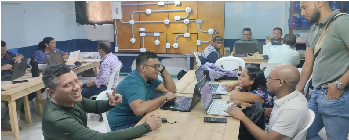
Reunión presencial articulación con la media CNCA 4 de mayo del 2026