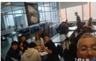
ABRIL 20 (GRUPO NUEVO)