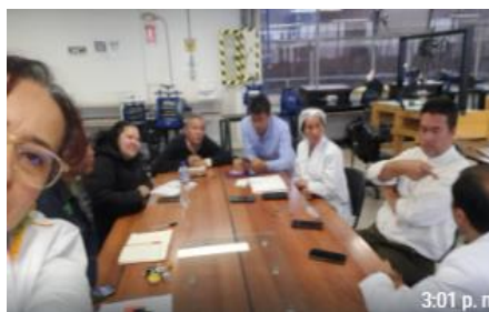
ABRIL 15 (ALISTAMIENTO TRI II