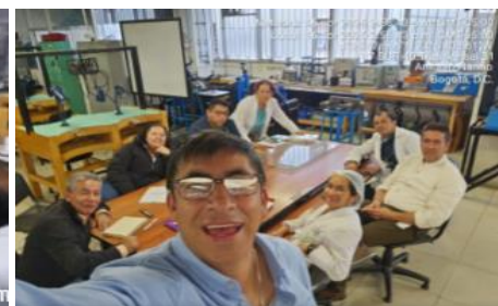
ABRIL 16 (ALISTAMIENTO TRI II