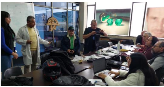
ABRIL 28 PROYECTO PRODUCTIVO