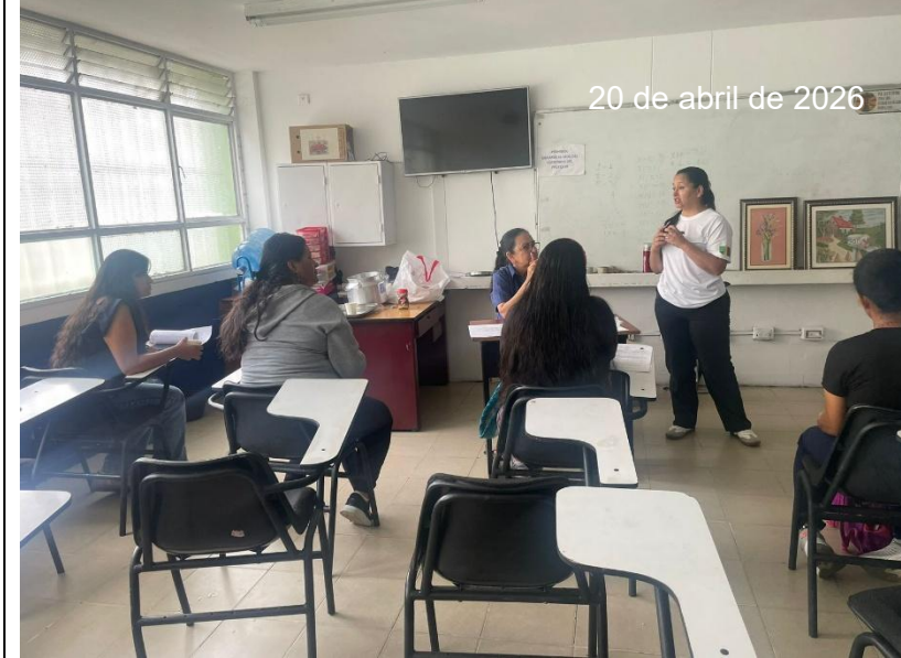
IE POLICARPA SALAVARRIETA- QUIMBAYA