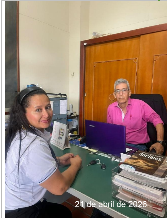
IE SAGRADO CORAZÓN DE JESUS - FILANDIA