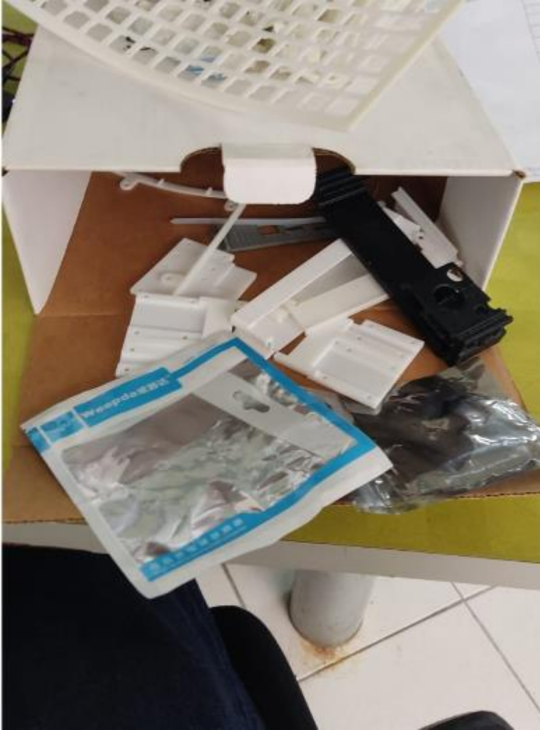
Imagen de avance de impresiones de proyectos de base tecnológica.