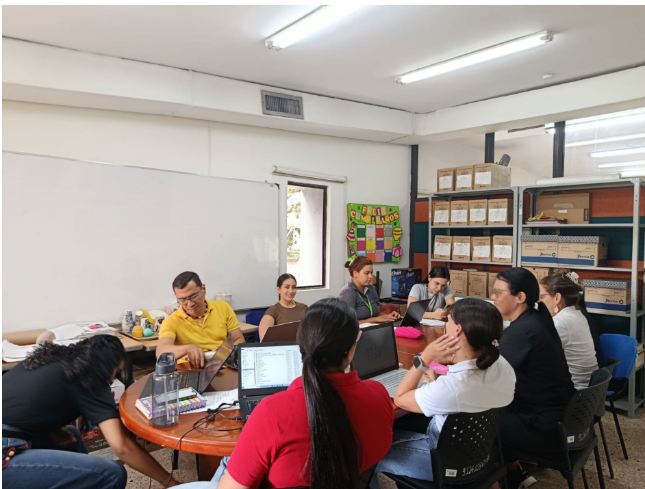
Reunión de equipo Bienestar al Aprendiz- 6 de abril 2026

Participo en las reuniones establecidas por el equipo de Bienestar al Aprendiz de acuerdo con el objeto contractual.