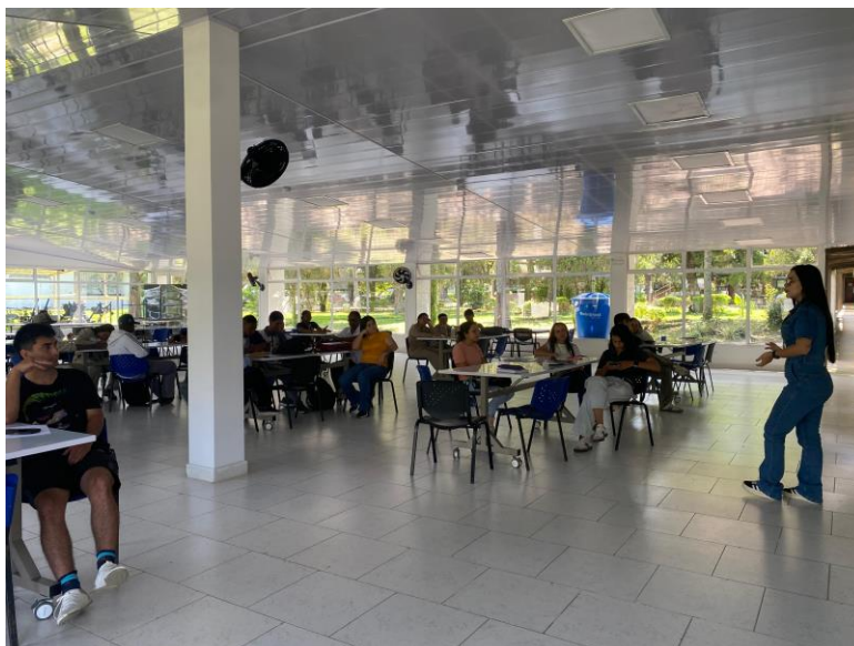
Actividades programadas apoyo de sostenimiento- mayo de 2026