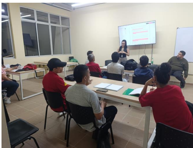
Inducción grupo FIC- mayo 2026

Participo en las reuniones establecidas por el equipo de Bienestar al Aprendiz de acuerdo con el objeto contractual.