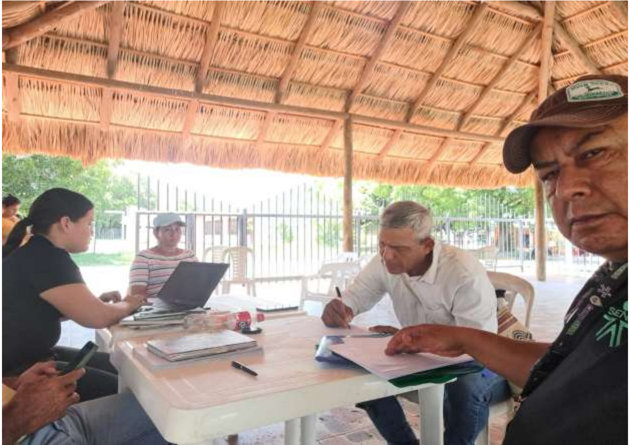
Municipio de la Mesa, prácticas de alimentación para pollo de engorde.