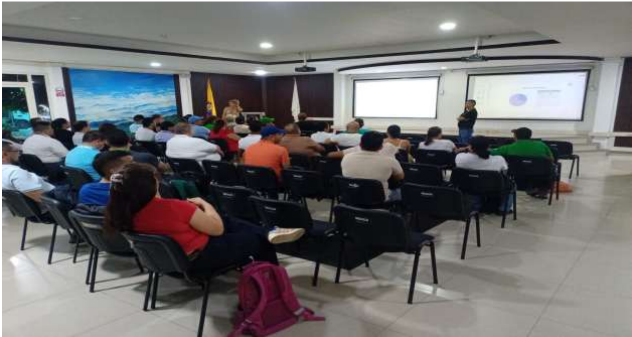
PANTALLAZO DIAGRAMADOR MES DE MAYO