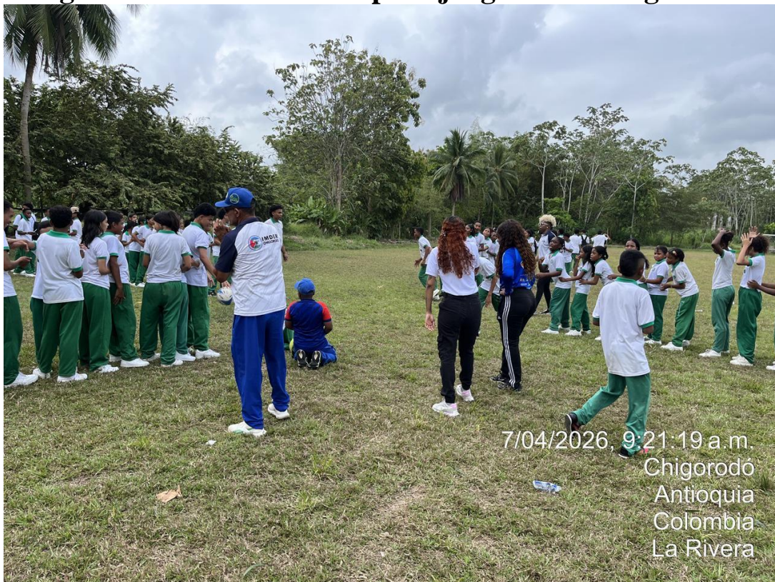
Apoyo fotográfico en actividad física en la I.E Agrícola de Urabá.