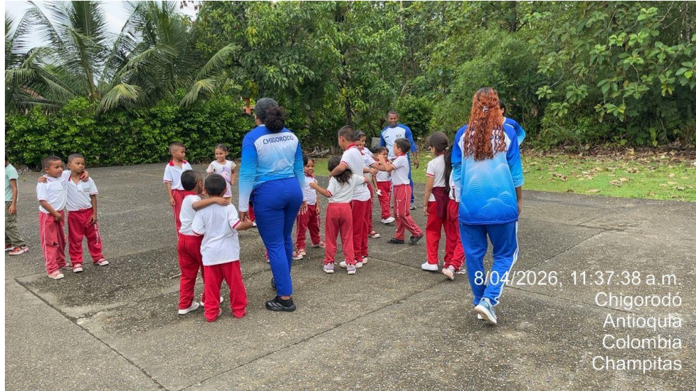
Apoyo fotográfico en actividad física en el marco de la semana del movimiento en Champitas.