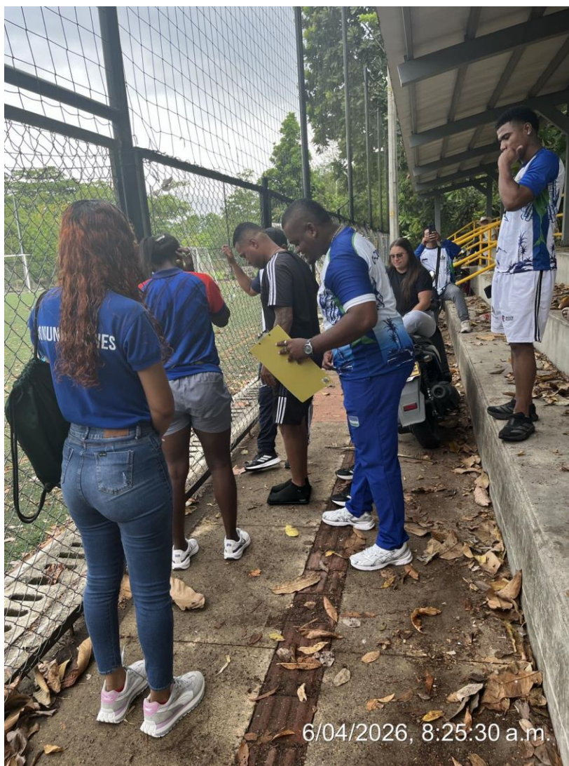
Apoyo fotográfico en la valoración antropométrica en la semana del movimiento