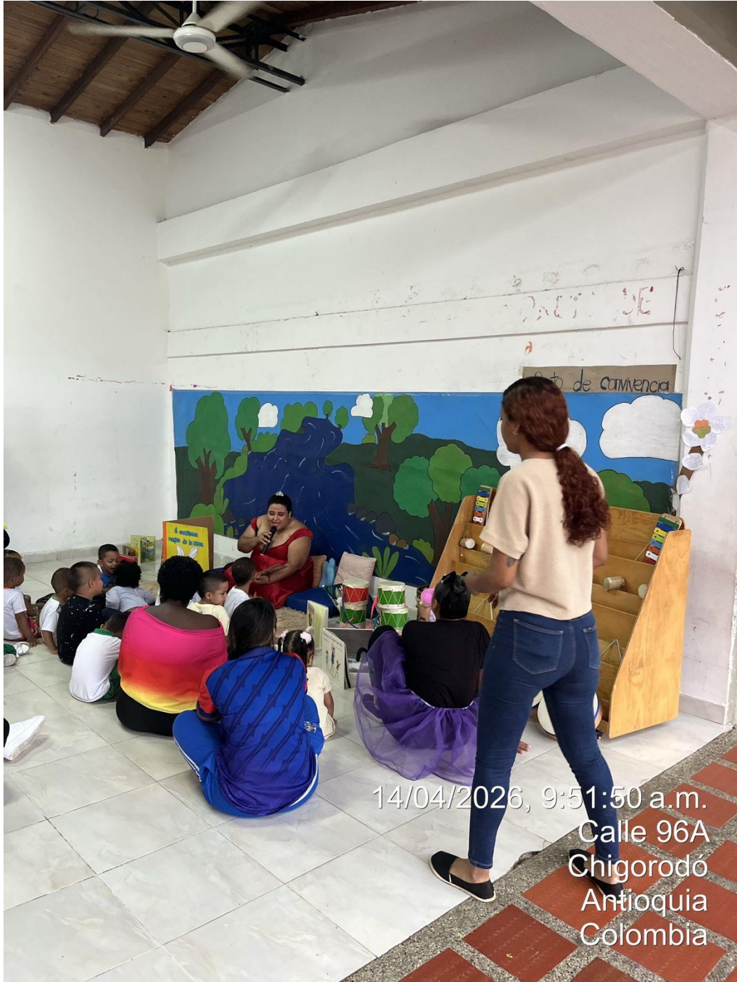
Apoyo fotográfico en la CDI Guayabal con la estrategia brújula en el marco del día del niño.