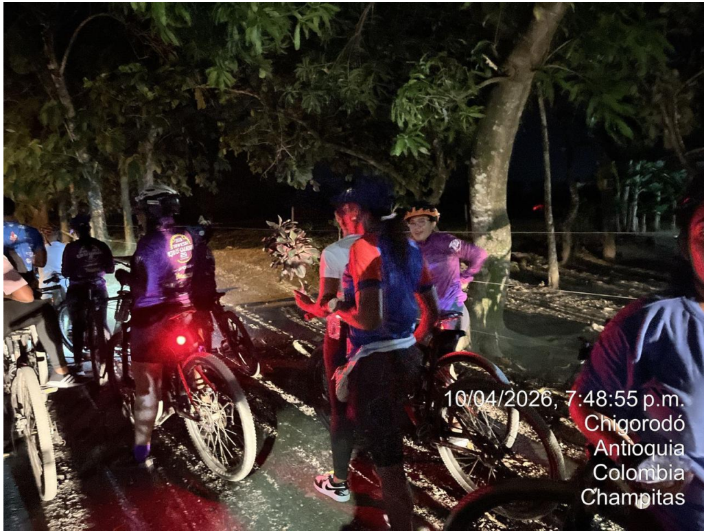
Apoyo fotográfico en el ciclo paseo nocturno- rural