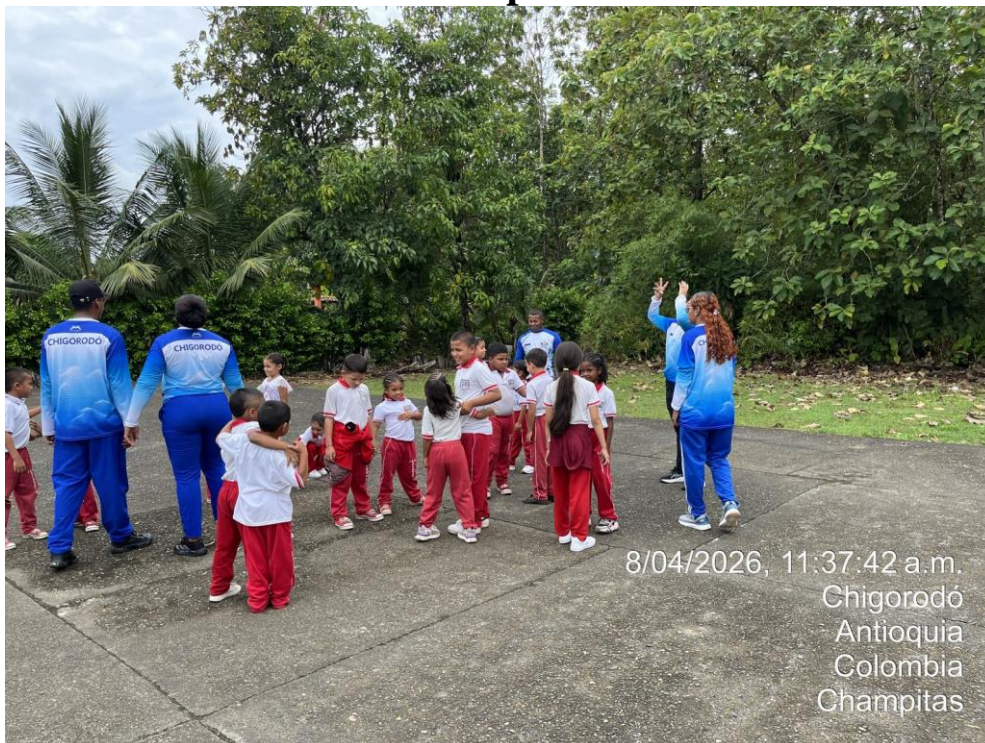
Apoyo fotográfico en actividad física en el marco de la semana del movimiento en Champitas.