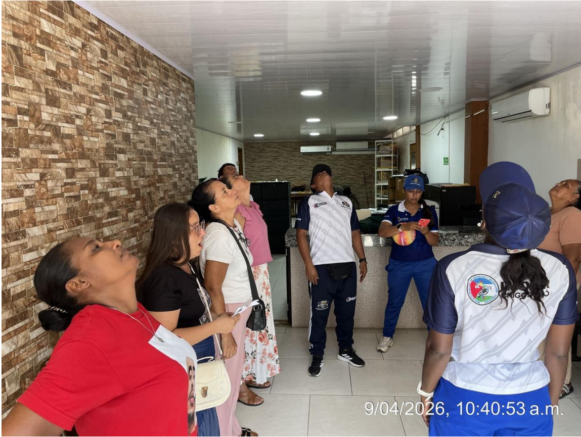
Apoyo fotográfico en las pausas activas con la administración (semana del movimiento).