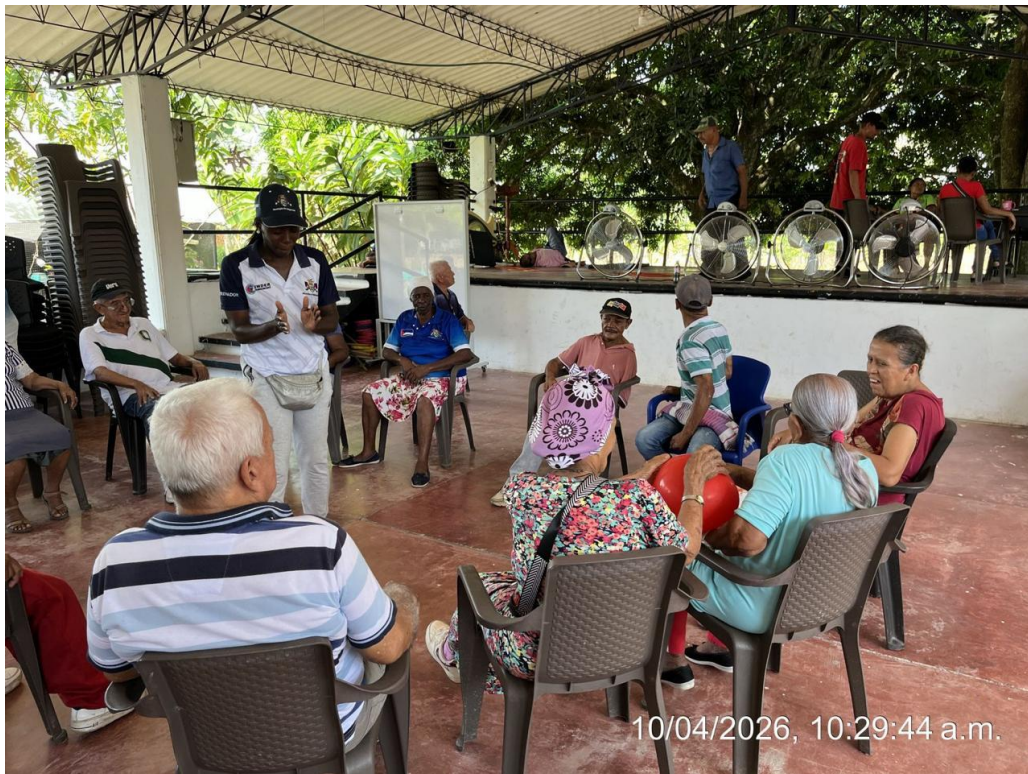
Apoyo fotográfico con actividad física en el centro día.