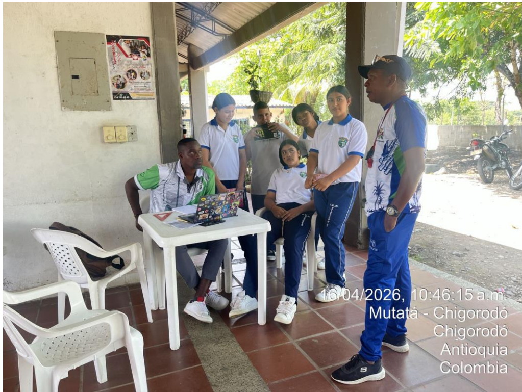
Apoyo fotográfico en convocatoria para juegos intercolegiados en Juradó