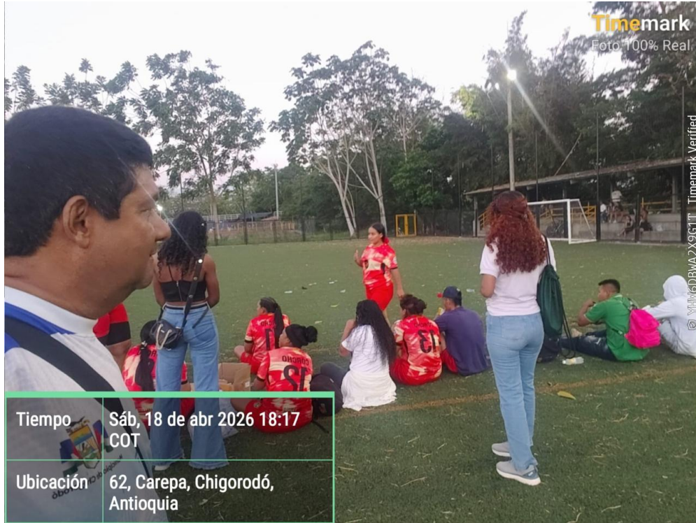
Apoyo fotográfico en la final del Torneo de fútbol Liga T.