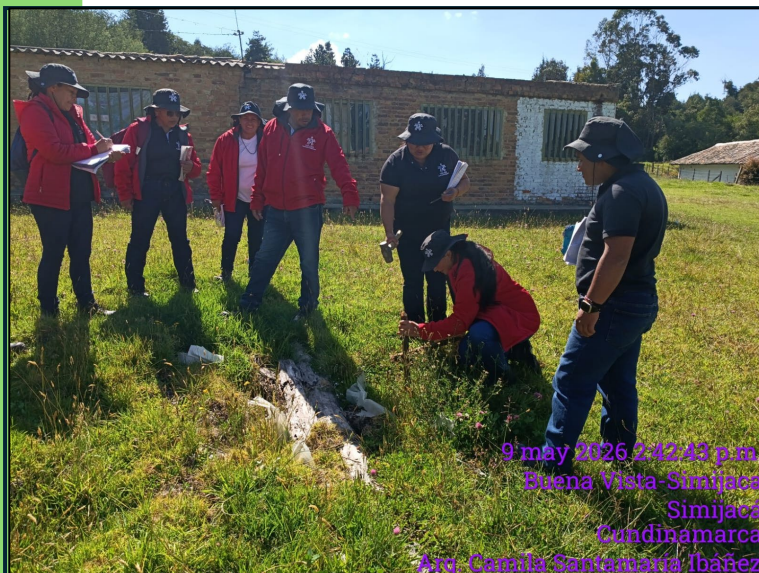
Socialización formación titulada Tc. Construcción de Edificaciones Grupo 3402037 y 3402038 Sede – CDA CHÍA Jornada fin de semana