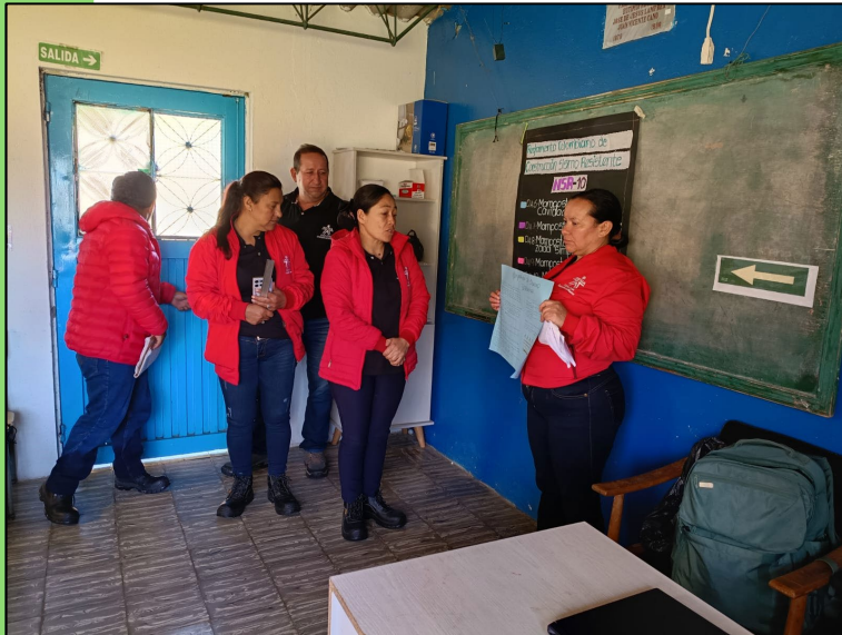
Sesión de formación titulada Tc. Construcción de Edificaciones Grupo 3402037 y 3402038 Sede – CDA CHÍA Jornada fin de semana