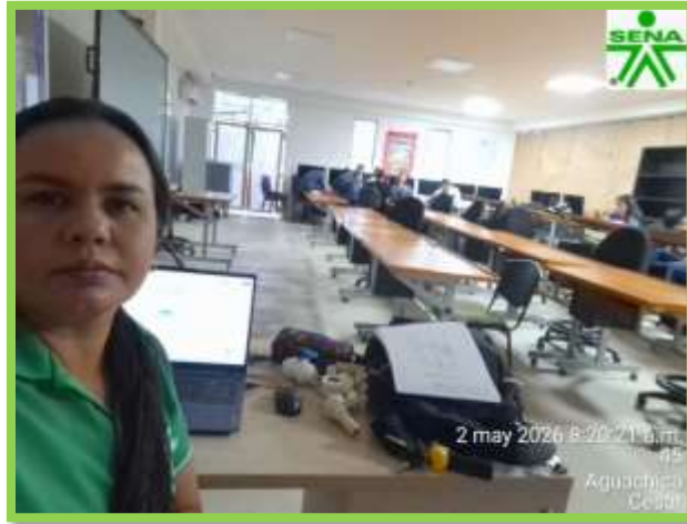
3313714 , Técnico de Dibujo digital de arquitectura e ingeniería, formación ambiente taller E, Jornada Noche, Centro Agroempresarial Aguachica CAE.