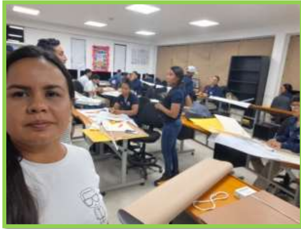
3154774 , Técnico de Dibujo digital de arquitectura e ingeniería, formación Colegio Técnico industrial Laureano Gómez