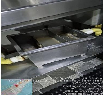
Actividad 12 C Y S ACU CASA DE LA MATILLA 15/04/2026