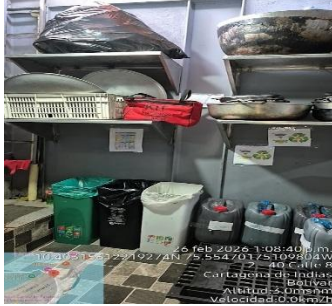
Actividad 11 C y S, ACU YO AMO BAZURTO MARBELLA