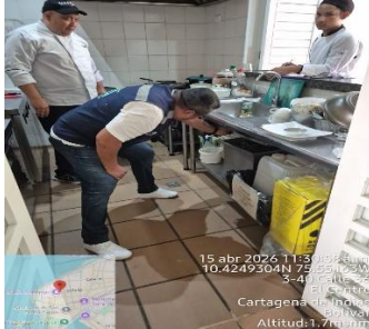
Actividad 13 C Y S ACU HOTEL LA FACTORIA 15/04/2026