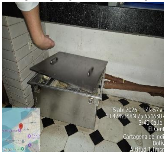
Actividad 13 C Y S ACU HOTEL CASA CANABAL 15/04/2026