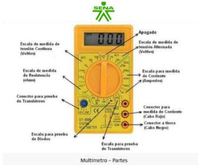
Multímetro - Partes

En este contexto, el multímetro se convierte en una herramienta fundamental para la medición de variables eléctricas, ya que permite identificar y analizar diferentes condiciones presentes en un circuito eléctrico. El conocimiento de este instrumento y el manejo adecuado de sus funciones contribuyen al desarrollo de habilidades técnicas necesarias para el trabajo con sistemas eléctricos y electrónicos.