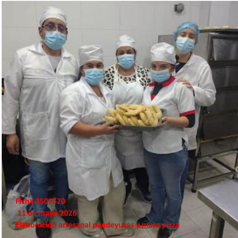
Ficha 3509620 11 de mayo 2026 Elaboración artesanal pandeyucas y masa pizza