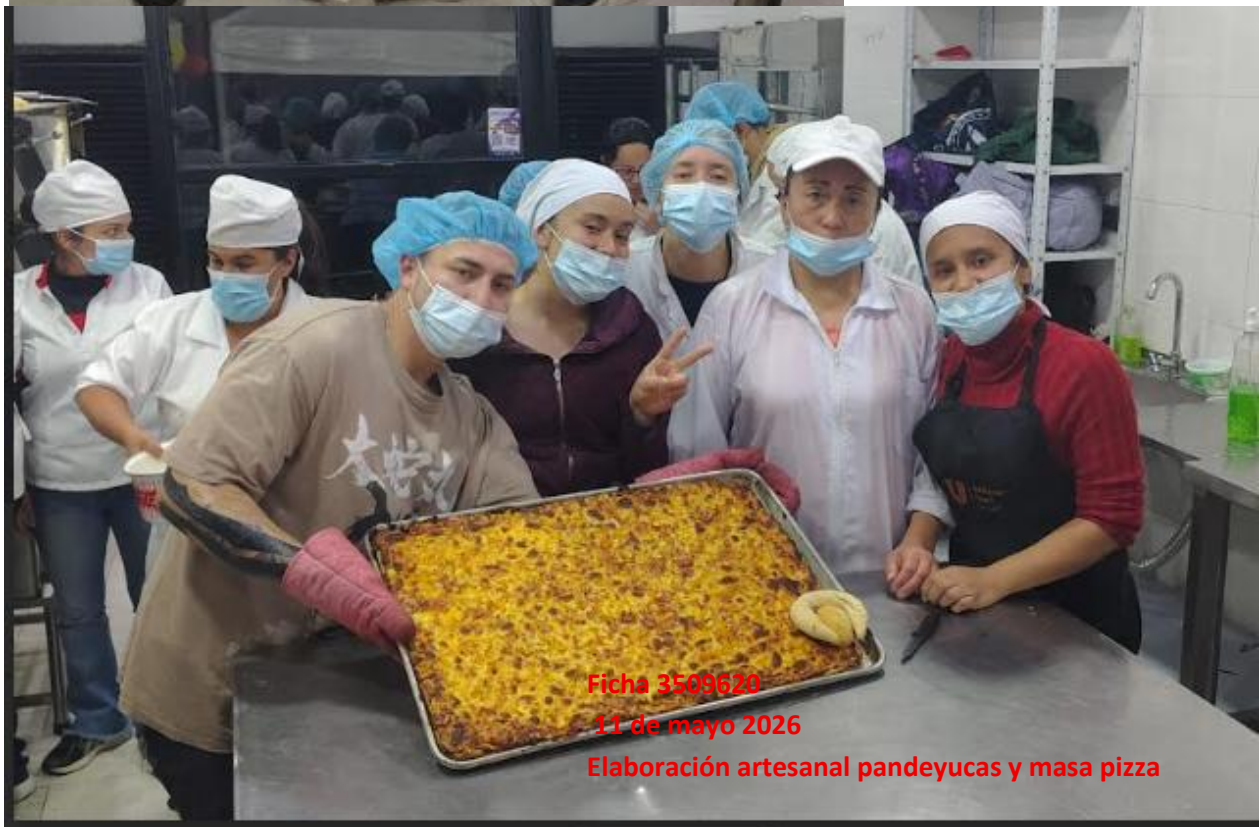
Ficha 3509620 11 de mayo 2026 Elaboración artesanal pandeyucas y masa pizza