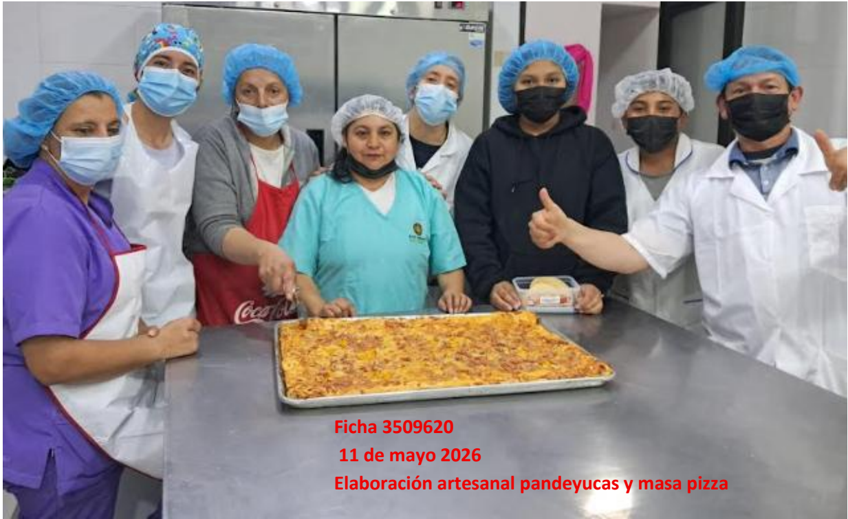
Ficha 3509620 11 de mayo 2026 Elaboración artesanal pandeyucas y masa pizza

*Correo enviado a coordinación académica formación complementaria