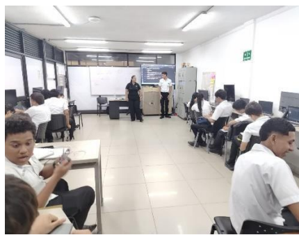
Proyecto de Vida y Sexualidad , Centro Industrial y de Aviación - 11 Mayo 2026