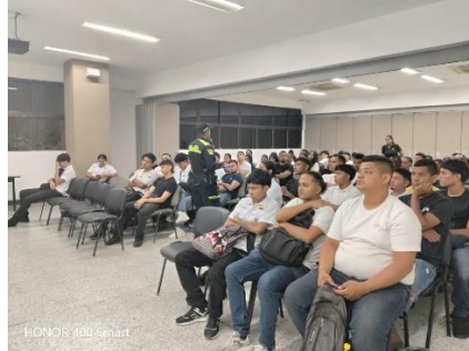
Sustancias Psicoactivas - Semáforo del Riesgo , Centro Industrial y de Aviación - 7 Mayo 2026