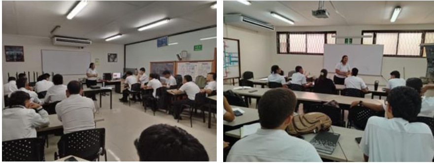
Jornada Prevencion de Enfermedades , Centro Industrial y de Aviacion - 12 Mayo 2026